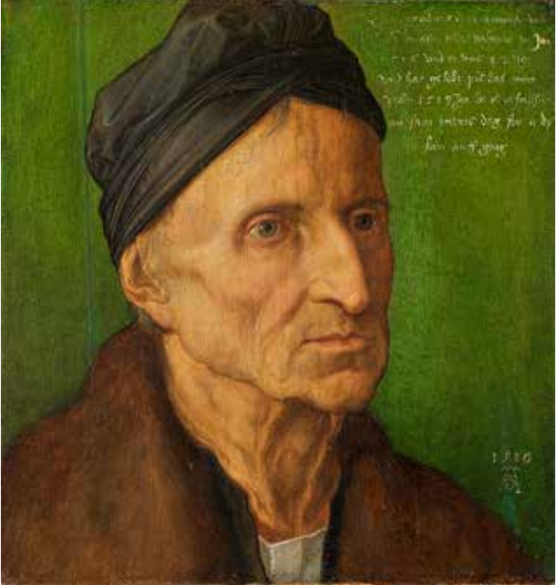
Albrecht Dürer: Bildnis des Nürnberger Malers Michael Wolgemut 1516