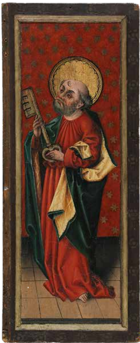
Werkstatt Michael Wolgemut: Hl. Petrus 1483