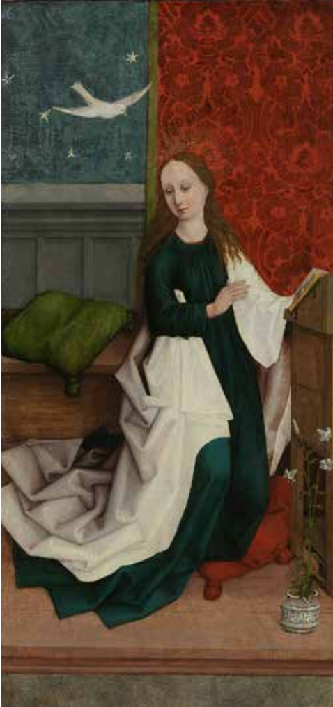
Werkstatt Hans Pleydenwurff: Maria einer Verkündigung, um 1455/60