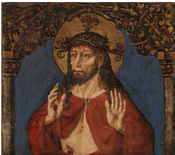
Werkstatt Michael Wolgemut: Predellenflügel eines unbekanntes Altars. Christus die Wundmale vorweisend, um 1490/1500