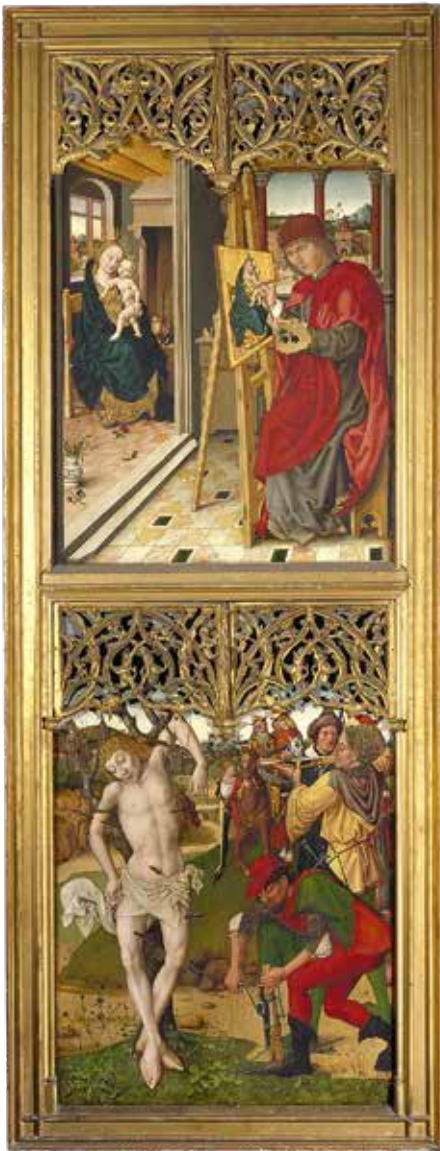
Werkstatt Hans Traut: Flügel des Hochaltarretabels der Nürnberger Augustinerkirche 1487