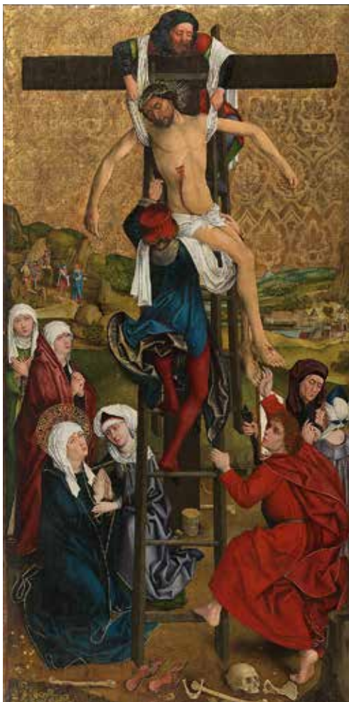
Hans Pleydenwurff: Kreuzabnahme des Breslauer Retabels 1462