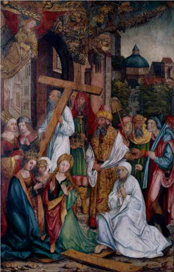
Werkstatt Michael Wolgemut: Zwei Flügel eines Retabels mit Szenen der Kreuzlegende um 1505/10

Gm 190 Dauerausstellung „Spätmittelalter“ (Raum 39)