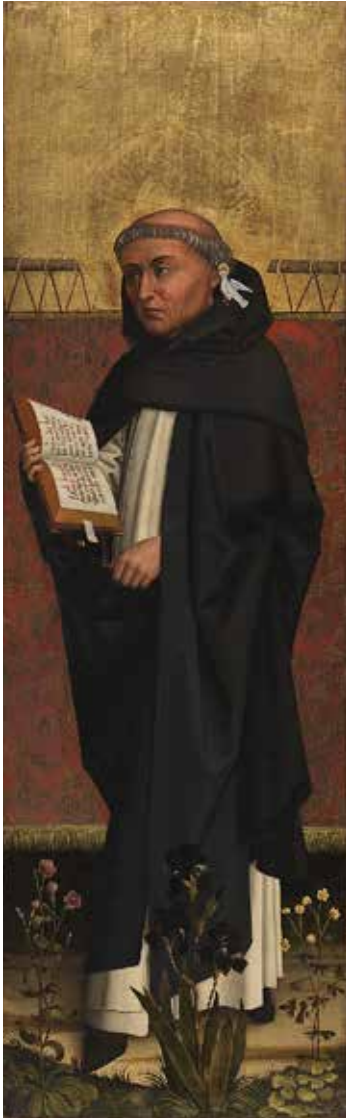
Werkstatt Hans Pleydenwurff: Hl. Thomas von Aquin aus der Nürnberger Dominikanerkirche um 1460/1465