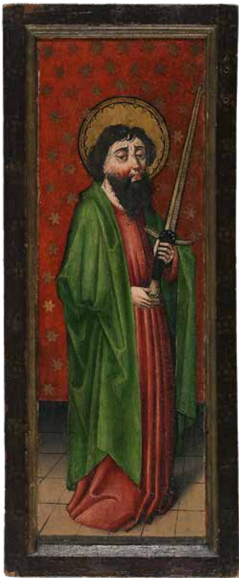
Werkstatt Michael Wolgemut: Hl. Paulus 1483