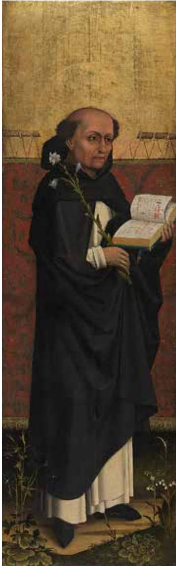
Werkstatt Hans Pleydenwurff: Hl. Dominikus aus der Nürnberger Dominikanerkirche um 1460/1465