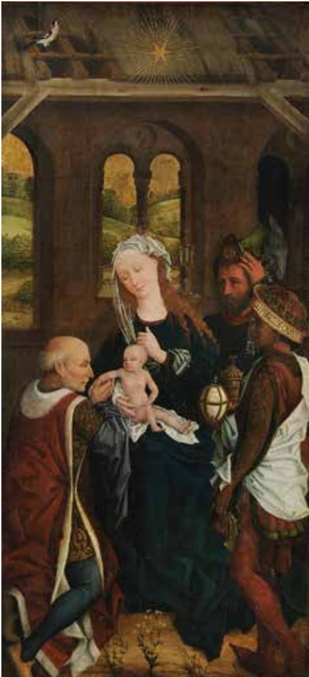
Hans Pleydenwurff: Anbetung der Heiligen Drei Könige um 1455/1460