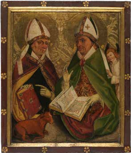
Werkstatt Michael Wolgemut: Predellenflügel des Harsdörffer-Retabels um 1485/98