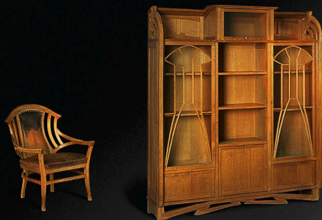
Titelabbildung: Sezessions-Schreibtisch, 1899 Sessel, Entwurf 1897 Bücherschrank, 1899 Zwei Stühle, Entwurf 1895 Kupferstichschrank, 1899 Fischbesteck „Modell I“, Entwurf 1902 Tischdecke, 1907/08 „Also sprach Zarathustra“, 1908