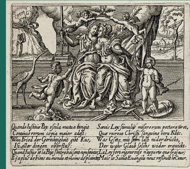
Jacob de Zetter, New Kunstliche Weltbeschreibung , Frankfurt: de Bry 1614, HAB, Sign. 39.7 Geom. (2)

LEIBNIZ-INSTITUT FÜR EUROPÄISCHE GESCHICHTE MAINZ