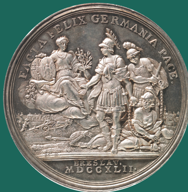
Martin Holtzhey, Medaille auf den Frieden von Breslau 1742, GNM, Med 3094

http://www.ieg-mainz.de/friedensrepraesentationen