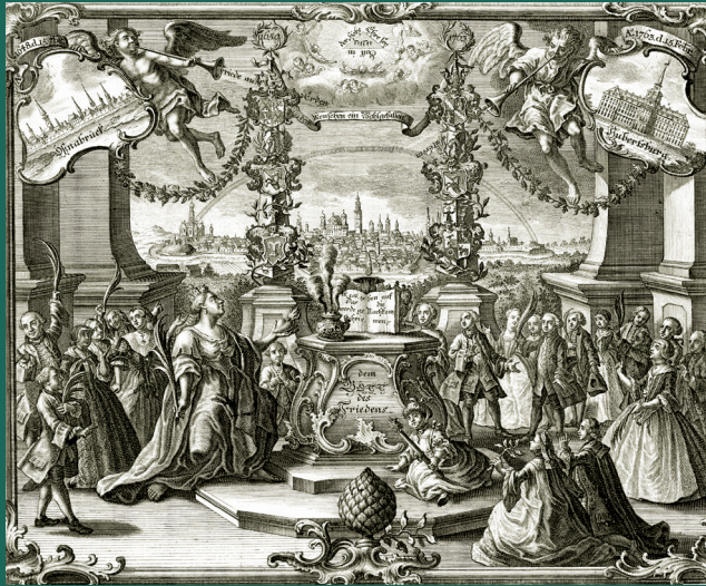
August Scheller/Jeremias Gottlob Rugendas, Gedenkblatt (Ausschnitt) zum Dank- und Friedensfest der evangelischen Schuljugend in Augsburg 1763, GNM, HB 6717, Kapsel 1249

Am Leibniz-Institut für Europäische Geschichte (IEG) Mainz wird das Gesamtprojekt koordiniert. Die Einbindung der Forscher vom Historischen Institut der polnischen Akademie der Wissenschaften in Warschau erfolgt durch Promotionsstipendien und Forschungsaufenthalte am IEG.