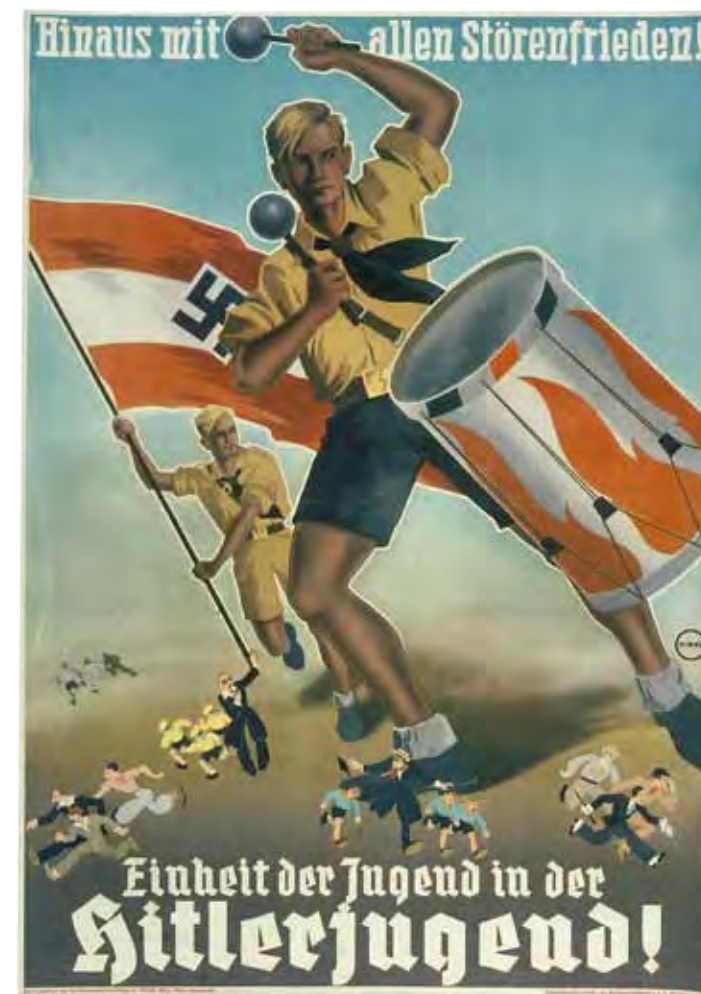
Plakat 1935, © Bundesarchiv Koblenz

Hrsg. von G. Ulrich Großmann, Claudia Selheim und Barbara Stambolis. Begleitband zur Ausstellung im Germanischen Nationalmuseum vom 26.09.2013 bis 19.01.2014. Nürnberg 2013, 344 S., 125 s/w und 182 farbige Abb., Festeinband, 27,5 x 22,5 cm. Preis im Museumsshop: € 25,-, Preis bei Versand und im Buchhandel: € 33,- ISBN 978-3-936688-77-1 Best.Nr. 758