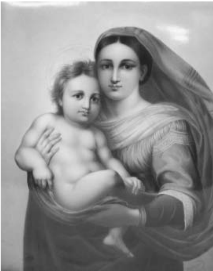
Porzellanbild mit der „Sixtinischen Madonna“ nach Raffael, Berlin, Königliche Porzellanmanufaktur, 1908. Maße: H 31,8 cm x B 25,6 cm. Marken: Preßmarke: Szepter mit Buchstaben KPM (ab 1837) und Jahresbuchstabe H (für 1908); im Bild unten rechts Malersignatur „Walther“ Des 1240.

Ein Porzellanbild der KPM Berlin von 1908