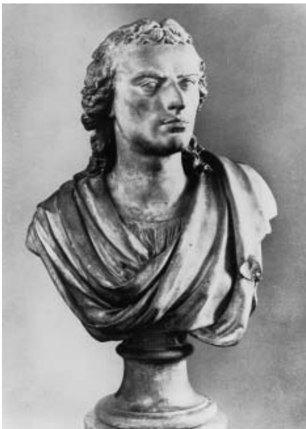
Johann Heinrich Dannecker – Friedrich Schiller, 1794. Gewandbüste in Gips. Kunstsammlungen zu Weimar, vordem (vermutlich aus Schillers Besitz) Großherzogliche Bibliothek zu Weimar.