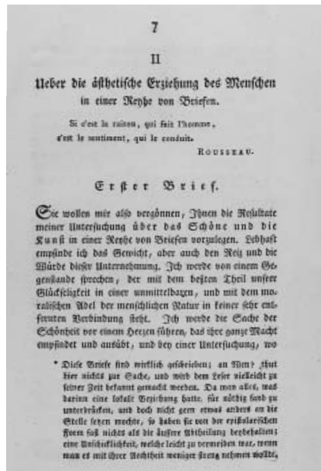
Friedrich Schiller – Über die ästhetische Erziehung des Menschen in einer Reihe von Briefen. In: Die Horen, eine Monatsschrift, herausgegeben von Friedrich Schiller. Tübingen: Cotta 1795. Signatur 8° L2661d. Erworben 1907.

Sein idealistisch vermittelndes Gedankenmodell brachte ihm als „Freiheitsdichter“ auch seitens regierender Häuser Hochachtung ein. Zum Kreis seiner treuesten Verehrer zählte die preußische Königin Luise, die sich für eine Überwindung rigi-