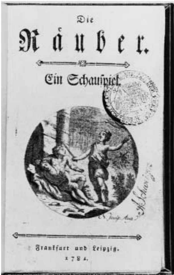
Friedrich Schiller – Die Räuber, 1781. Titelblatt der ersten, anonym erschienenen Ausgabe des Schauspiels, die Friedrich Schiller auf eigene Kosten bei Metzler in Stuttgart drucken ließ (die angegebenen Verlagsorte Frankfurt und Leipzig waren fingiert). Signatur 8° Oo178/9. Slg. Neuforge, erworben 1961.

In Frankreich wurden Schillers „Räuber“ unter dem Titel „Robert, chef des brigandes“ zum größten Theatererfolg der Revolutionszeit. 1792 verlieh ihm die französische Nationalversammlung sogar das Ehrenbürgerrecht. Damals wurden eine Reihe ausländischer Schriftsteller, Pädagogen und Gelehrter, die sich für die Sache der Freiheit und Menschlichkeit eingesetzt hatten, zu französischen Ehrenbürgern ernannt. Der im Oktober 1792 an Schiller abgesandte Ernennungsbeschluss erreichte ihn erst im Frühjahr 1798. Damals stand er der Revolution längst kritisch gegenüber. Er war enttäuscht über den Verlauf der Revolution, entsetzt über das rohe Verhalten der entfesselten Masse in der Zeit des terreur und kritisierte den politischen Missbrauch von Schrecken und Gewalt als Verrat an den humanistischen und freiheitlichen Idealen.