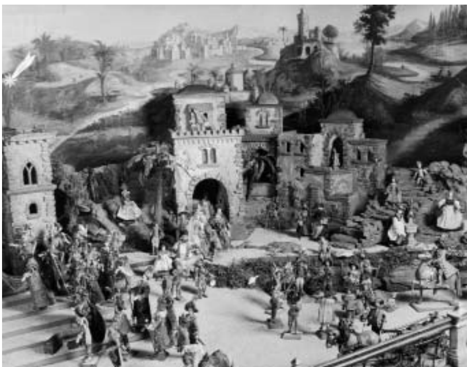
Die Hochzeit zu Kana.