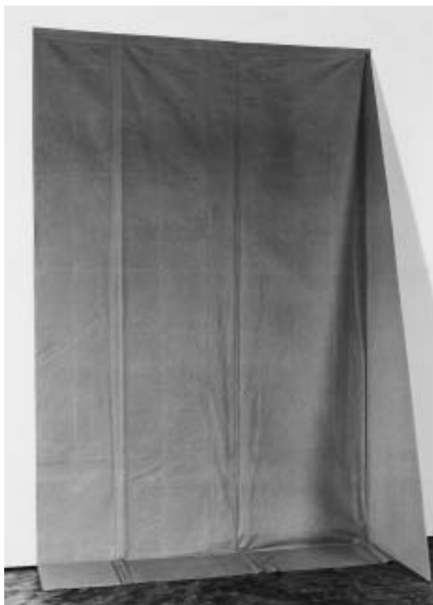
Franz Erhard Walther (geb. 1939 in Fulda, lebt in Hamburg) – Öffnung, 1980.

Ins Zentrum seiner Überlegungen stellte er den Begriff der Formung. Er kreierte Objekte aus Stoff, die man benutzen kann. Er demonstrierte das in Aktionen, in denen er sie häufig als Mittel der Interaktion einsetzte. Walther bezeichnete seine Objekte als „Instrumente für etwas. Wichtig sind nicht die Objekte, sondern das, was man damit tut.“ Entsprechend bezeichnete er die Rezipienten seiner Kunst als