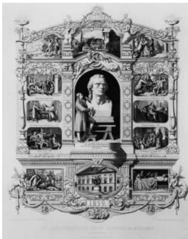
Gedenkblatt zur Saecularfeier der Geburt Friedrich von Schiller's am 10. November 1859 . Radierung von Hugo Bürkner im Verlag Rudolf Kuntze, Dresden. Inv. Nr. K 16630, Kapsel 1015. Alter Bestand.