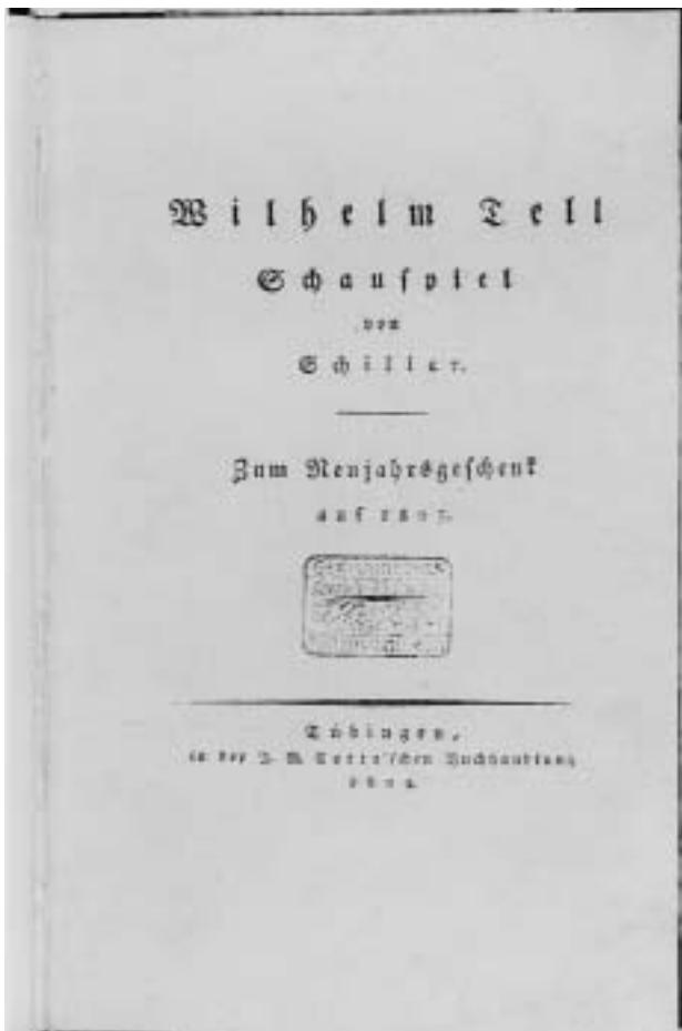
Friedrich Schiller – Wilhelm Tell. Tübingen: Cotta 1804. Signatur 8° L 1220t. Erworben 1907.

der Standesgrenzen und die Durchsetzung von Reformen in Preußen einsetzte. Vermutlich hatte sie den Wunsch ausgedrückt, Schiller für Berlin zu gewinnen, der im Jahr vor seinem Tod an ihn herangetragen wurde. Noch in seinem letzten Theaterstück, dem 1804 vollendeten „Wilhelm Tell“, das sein größter Theatererfolg wurde, hatte Schiller den Kampf gegen Despotismus und die Gründung eines Staates auf der Grundlage allgemeiner Menschenrechte beschworen.