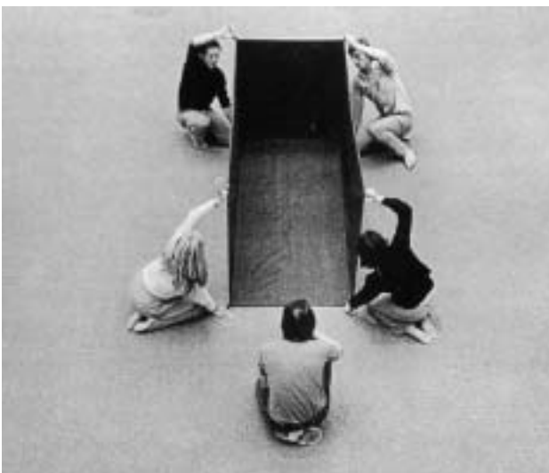
Franz Erhard Walther (geb. 1939 in Fulda, lebt in Hamburg) Kopf Leib Glieder, 1967 Baumwollstoff, 110 x 110 x 275 cm Abb. aus: Künstler. Kritisches Lexikon der Gegenwartskunst, hrsg. von Lothar Romain und Detlef Bluemler. München 1988.