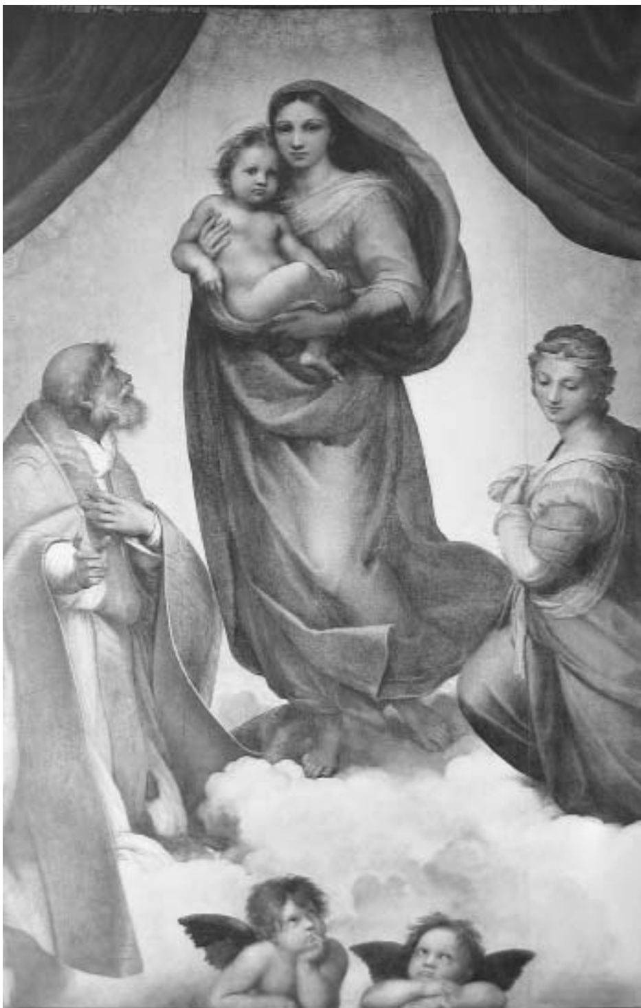
„Sixtinische Madonna“ von Raffael, 1513/14, Dresden, Gemäldegalerie Alte Meister, 265 x 196 cm, Öl auf Leinwand.

Künstlerviten. Das Altarbild dürfte wohl noch unter dem Pontifikat Julius II. (della Rovere, geb. 1453, Papst 1503–1513) in Auftrag gegeben worden sein, denn Julius stand schon zu Anfang des 16. Jahrhunderts mit dem Kloster, das bedeutete