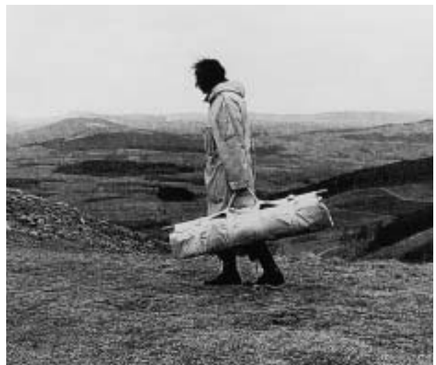
Franz Erhard Walther (geb. 1939 in Fulda, lebt in Hamburg) Sammler Form, 1966 Baumwollstoff, Holz, Schlauchstück, 200 x 119 cm Abb. aus: Künstler. Kritisches Lexikon der Gegenwartskunst, hrsg. von Lothar Romain und Detlef Bluemler. München 1988.