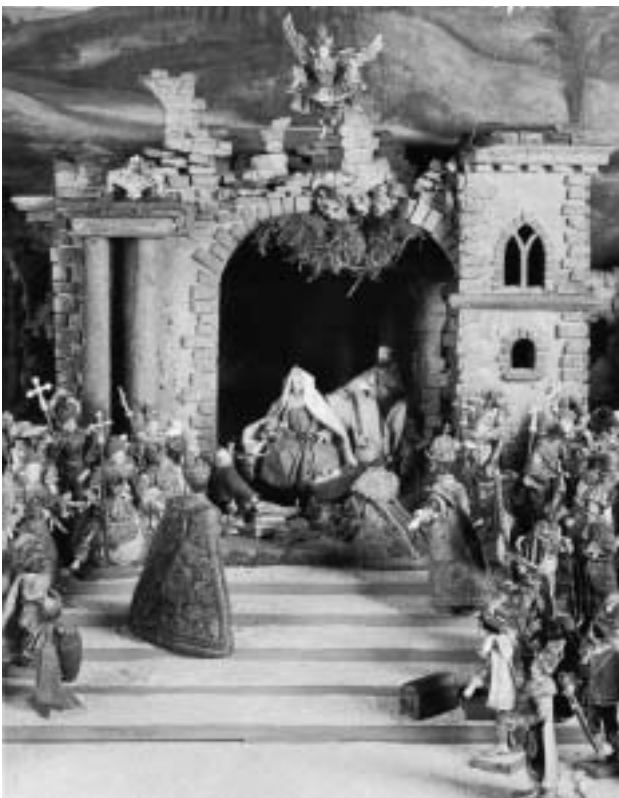
Die Anbetung der hl. Drei Könige.

Mit ihren 117 Figuren mit Wachsköpfen und holzgeschnitzten Gliedern sowie 70 geschnitzten Tieren und einem 5,60 Meter langen, bemalten Hintergrundprospekt ist das aus Tirol stammende Ensemble des Germanischen Nationalmuseum ein repräsentatives Beispiel für Krippen mit bekleideten Figuren, wie sie in der 2. Hälfte des 18. und zu Beginn des 19. Jahrhunderts in Tirol, ähnlich wie in Süddeutschland, in Kirchen oder großen Kappellen zu finden waren.