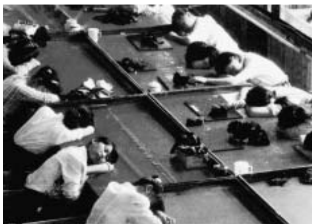
Abb. 2) Arbeiterinnen einer Schuhfabrik in Schanghai, Pressephoto.