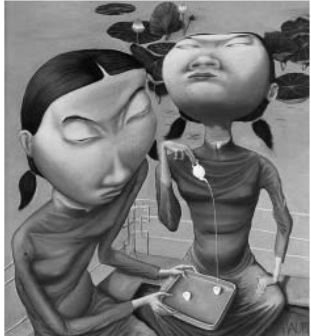
Abb. 3) Christoph Haupt, „Das Lernen und des Lernens Ziel“, Öl auf Leinwand, 95 x 105cm, 2005.

Christoph Haupt arbeitete bereits verschiedentlich mit Johannes Grützke zusammen, wovon die Künstlerzeitschrift „Der Prager“ Zeugnis gibt. Im Künstlerbuch „Der Prager in China“, das spätestens 2006 in Kooperation mit dem Germanischen Nationalmuseum erscheinen soll, findet ihr gemeinsames Schaffen seine Fortsetzung. In dem im Handsatz gesetzten und in der Druckwerkstatt des GNM im Buchdruck gedruckten Werk machen sich die Künstler Gedanken über den Wachstumsmarkt China. Sie berichten in dieser literarischen Erstveröffentlichung witzig und hinter sinnig über Merkwürdigkeiten, Eitelkeiten, Traditionen und natürlich über die Frauen aus dem Reich der Mitte. Seinen besonderen Reiz erfährt dieses großformatige Buch durch die Originalgraphiken, die die Texte begleiten. Die zwanzig Linolschnitte, mal farbig, mal monochrom gedruckt, zeichnen ein sehr eigener