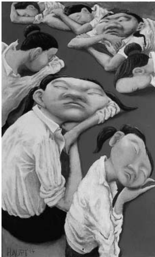
Abb. 1) Christoph Haupt, „Bei der Fahne“, Öl auf Leinwand, 55 x 90cm, 2004.