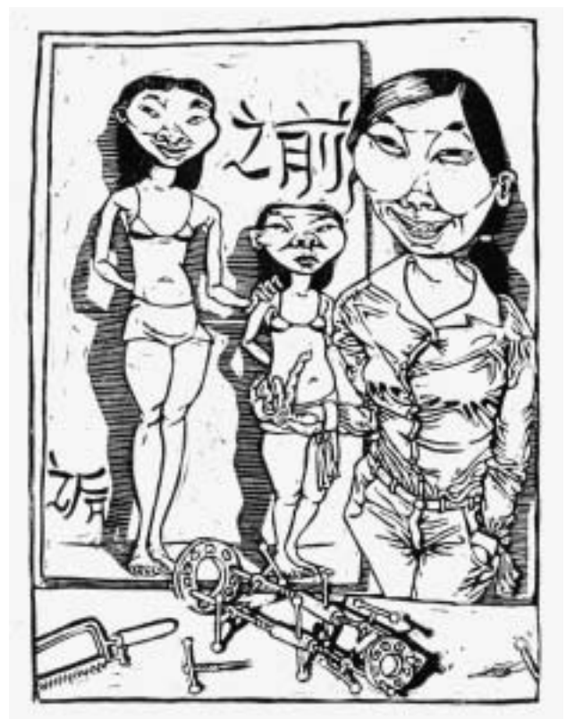
Abb.4.) Christoph Haupt, „Beinverlängerung“, Linolschnitt, ca. 20 x 27cm, 2005.