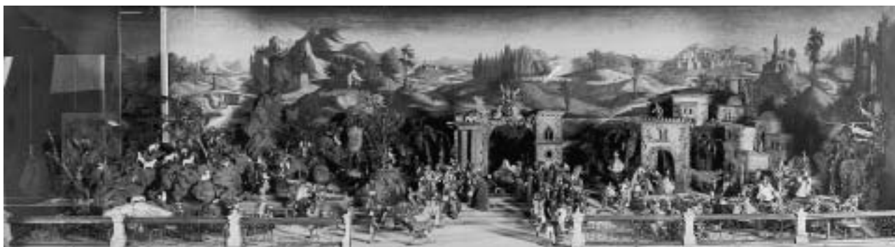
Kirchenkrippe mit gekleideten Figuren Inv. Nr. KG 1178 und gemaltem Hintergrund. Tirol, Ende 18./ Anfang 19. Jh.

Die als Gliederpuppen gestalteten Krippenfiguren besaßen überwiegend aus Wachs gegossene Köpfe und hölzerne Glied-maßen. Vollständig aus Holz gearbeitet waren lediglich die Krippentiere. Die Kleidung der Figuren bestand aus kostbaren Samt und Seidenstoffen; und vielfach waren es Reste von Para-