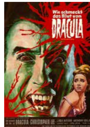
Filmplakat zu „Wie schmeckt das Blut von Dracula“ Hammer Productions, England, 1969, Nürnberg, Germanisches Nationalmuseum

Im Mittelalter gelten manche Monster als göttliche Zeichen. Sie zeigen sich in vielerlei Gestalt, als Mischwesen aus Mensch und Tier, als Seeungeheuer, wilder Drache oder todbringendes Einhorn. Der Glaube an ihre Existenz gibt beredtes Zeugnis über Vorstellungen der göttlichen Ordnung, in der das Wunderbare seinen festen Platz hat. Monster in Form von Teufeln und schrecklichen Dämonen bevölkern Laster- und Höllendarstellungen. Sie bedrängen und begleiten uns auf dem schmalen Grat zwischen Tugend und Laster.