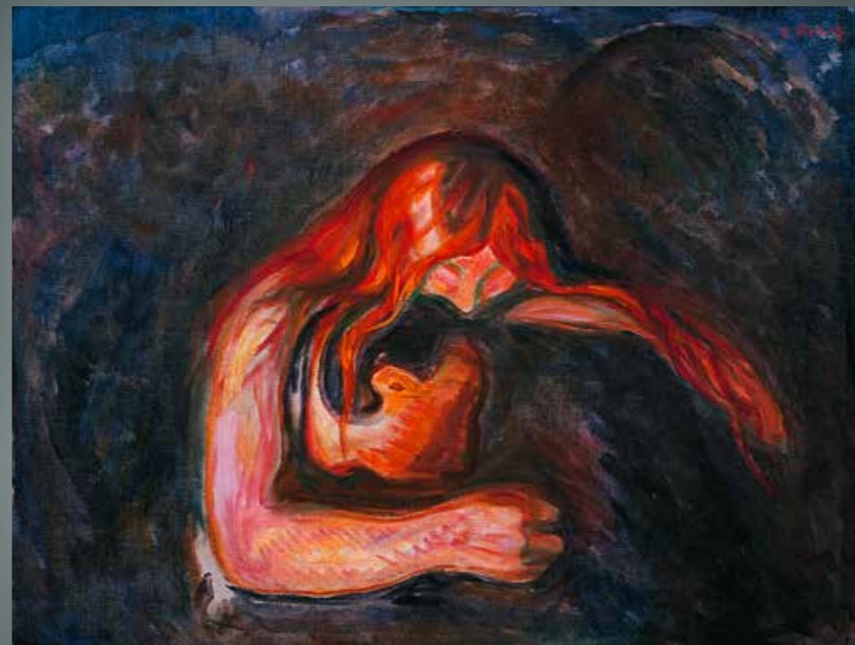
Vampir, Edvard Munch, 1917, Schwäbisch Hall, Kunsthalle Würth