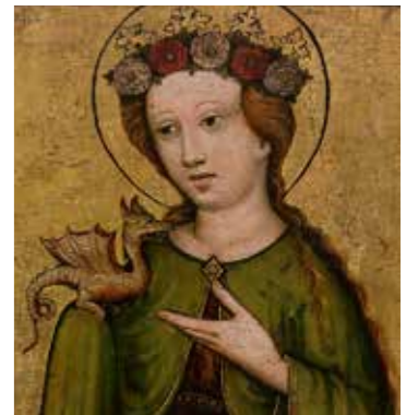
Heilige Margarete, Ausschnitt, um 1450, Nürnberg, Germanisches Nationalmuseum