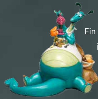
Figur nach Walt Disneys Cartoon-Version von „The Reluctant Dragon“, 1936, © Disney

Ein Schwerpunkt der Ausstellung liegt auf den Drachen. Sie sind die Hauptdarsteller in vielen spannenden Legenden. Fast immer werden Drachen als gefährliche Feinde der Menschen angesehen. Daher muss ein mutiger Held den Drachen im Kampf besiegen. Bereits im Mittelalter findet man Wege, seine negativen Bedeutungen einzuschränken, mitunter sogar ins Positive zu wenden. Aber erst mit dem Kinderbuch im 19. Jahrhundert bekommt der Drache freundliche, fröhliche oder traurige, kurz menschliche Züge.