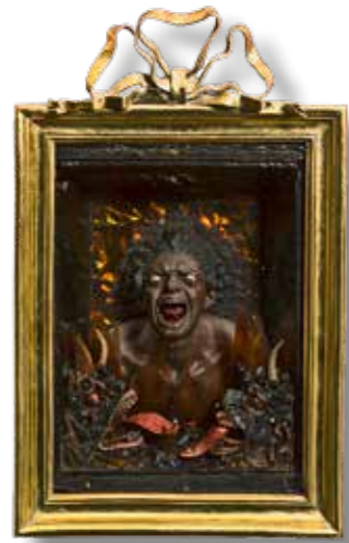
Seele in der Hölle, nach Giovanni Bernardino Azzolino, um 1690, Florenz, Museo degli Argenti

Erstmals befasst sich eine Ausstellung zeit- und gattungsübergreifend mit Monstern, um den wechselvollen Verlauf ihrer Dämonisierung und Entdämonisierung darzustellen. Darüber hinaus gibt sie oftmals unbekannte Einblicke in die fantastischen Welten dieser wundersamen Wesen. Die Exponate, darunter zahlreiche Leihgaben aus dem In- und Ausland, reichen vom Mittelalter bis in die Moderne. Gemälde, darunter Meisterwerke von Edvard Munch und Max Beckmann, Grafiken von Albrecht Dürer und Federico Zuccari, prachtvolle Buchmalereien aus dem berühmten „Codex Aureus“ von Echternach sowie Skulpturen, Wandteppiche und reich verzierte Möbel, aber auch Filme und Videokunst werden spannend präsentiert.