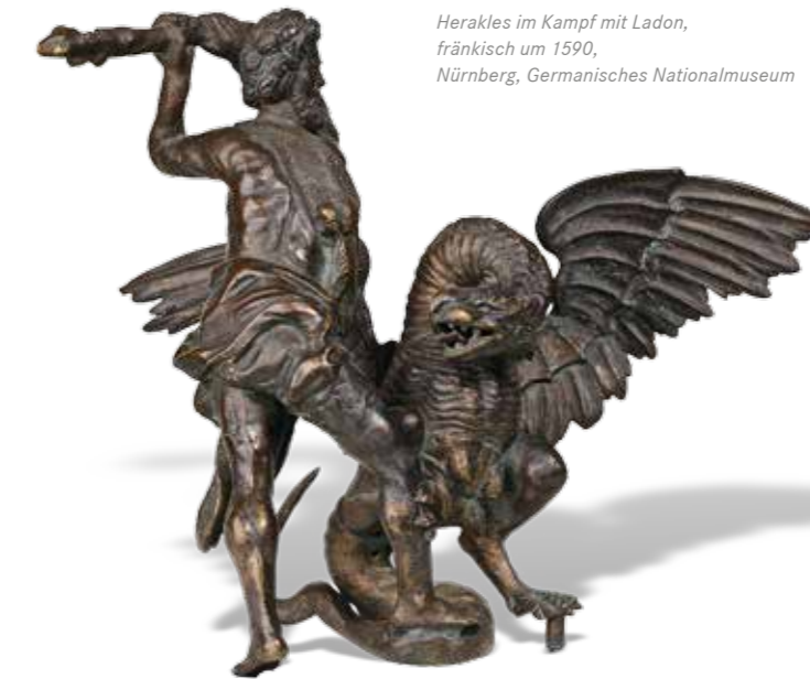
Herakles im Kampf mit Ladon, fränkisch um 1590, Nürnberg, Germanisches Nationalmuseum