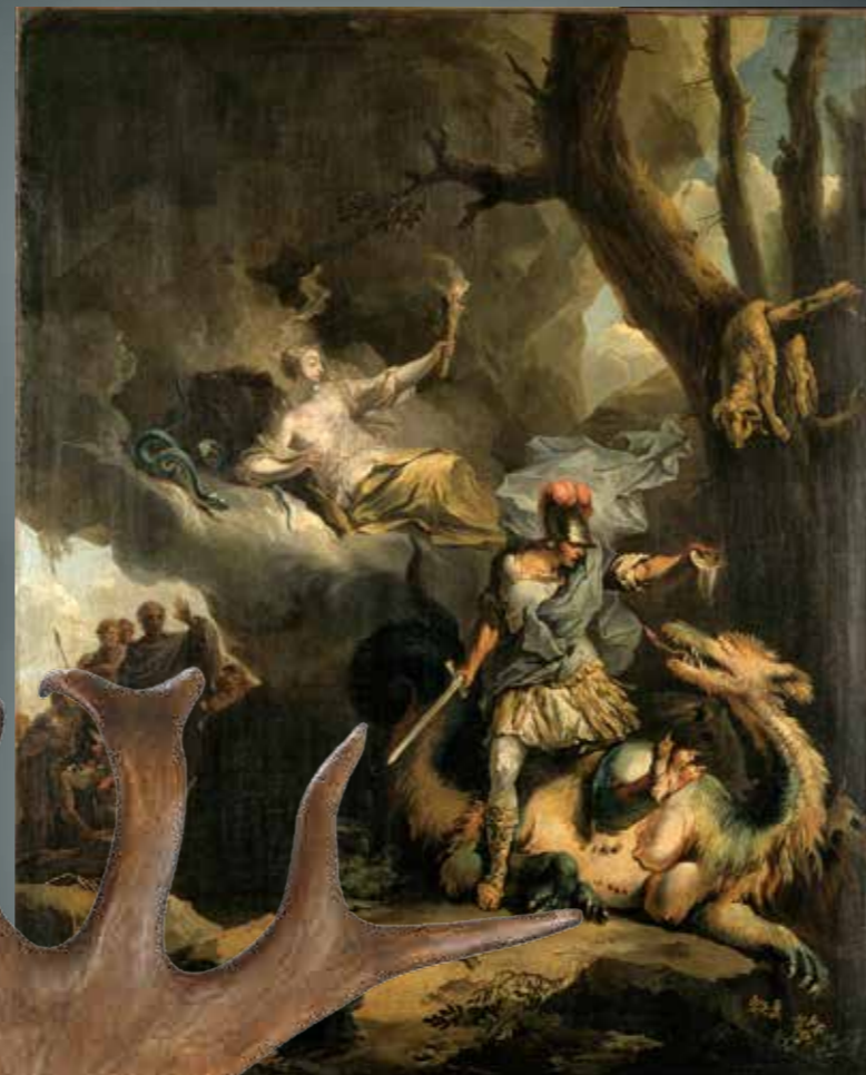
Jason tötet den kolchischen Drachen, Christian Wilhelm Ernst Dietrich, 1760/1770, Dessau, Anhaltische Gemäldegalerie

Ein Schwerpunkt der Ausstellung liegt auf den Drachen. Sie sind die Hauptdarsteller in vielen spannenden Legenden. Fast immer werden Drachen als gefährliche Feinde der Menschen angesehen. Daher muss ein mutiger Held den Drachen im Kampf besiegen. Bereits im Mittelalter findet man Wege, seine negativen Bedeutungen einzuschränken, mitunter sogar ins Positive zu wenden. Aber erst mit dem Kinderbuch im 19. Jahrhundert bekommt der Drache freundliche, fröhliche oder traurige, kurz menschliche Züge.