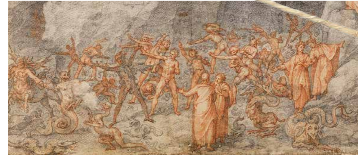
Dante historiato, Inferno, Canto XXIV/XXV, Ausschnitt, Federico Zuccari, 1585-1593, Florenz, Gabinetto Disegni e Stampe degli Uffizi