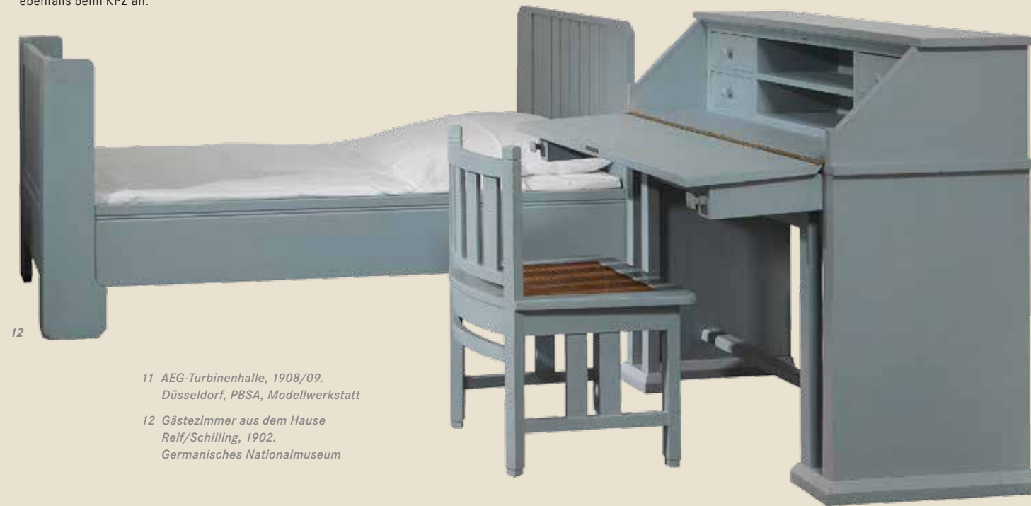
11 AEG-Turbinenhalle, 1908/09. Düsseldorf, PBSA, Modellwerkstatt