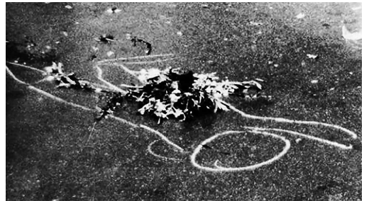
Bild- und Ton-Fundstücke, aufgenommen im Berliner Stadtraum und am Fernsehbildschirm, montiert Raoul Peck zum Dementi einer Behauptung von Einheitskanzler Helmut Kohl: »Wir haben aus der Geschichte gelernt.«