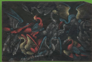
Oben links: Heil-Epiphani, GNM; oben rechts: Hans Plödenwurff (F. Streitende Vogel), UB Erlangen; unten: Schwabacher Hochaltar (Detail), Tübingen; Albrecht Dürer, Bildnis Michael Wolgemut, GNM