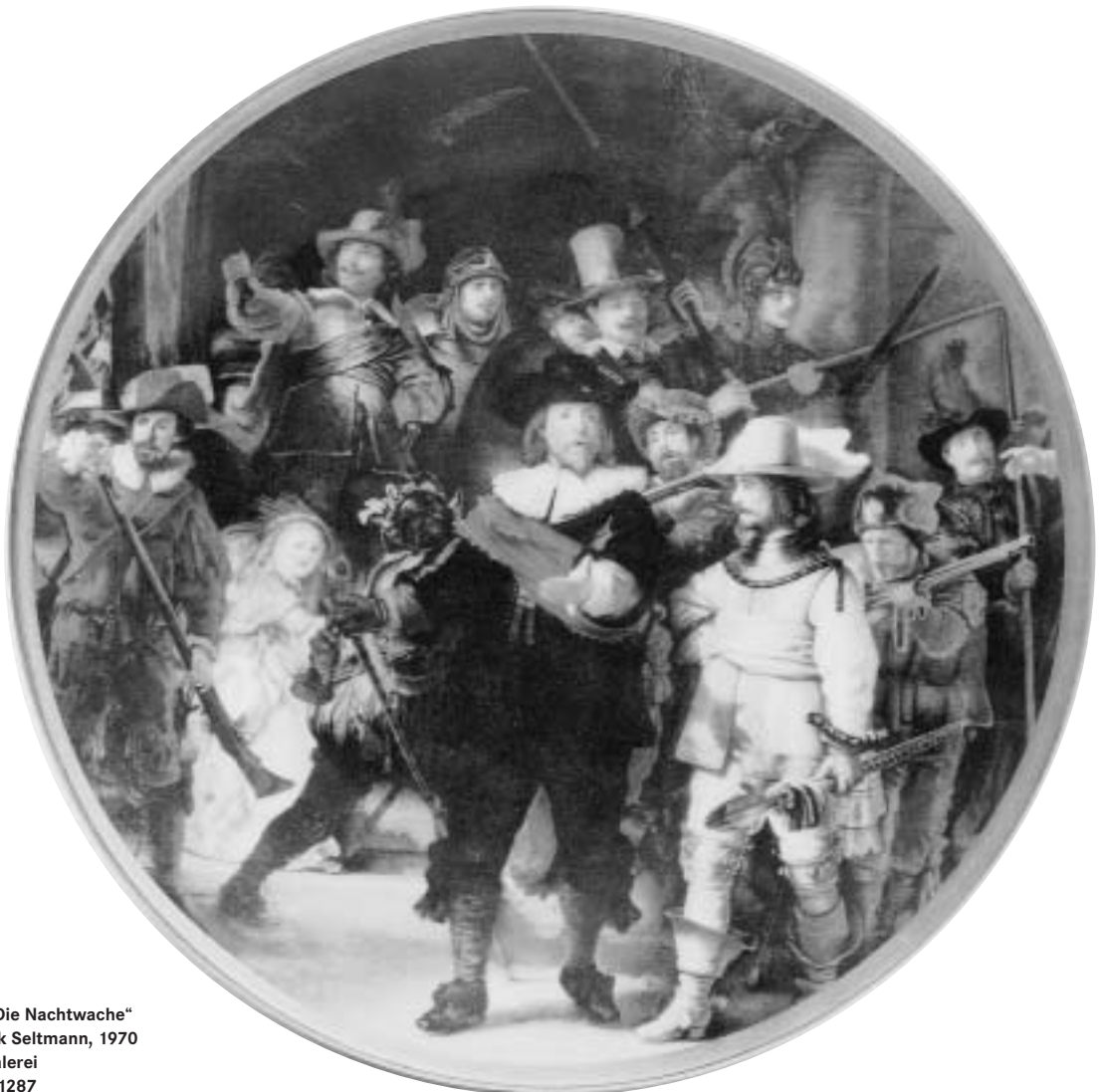
Teller mit dem Motiv „Die Nachtwache“ Weiden, Porzellanfabrik Seltmann, 1970 Porzellan, Aufglasurmalerei Dm. 26,8 cm, Inv. Des 1287