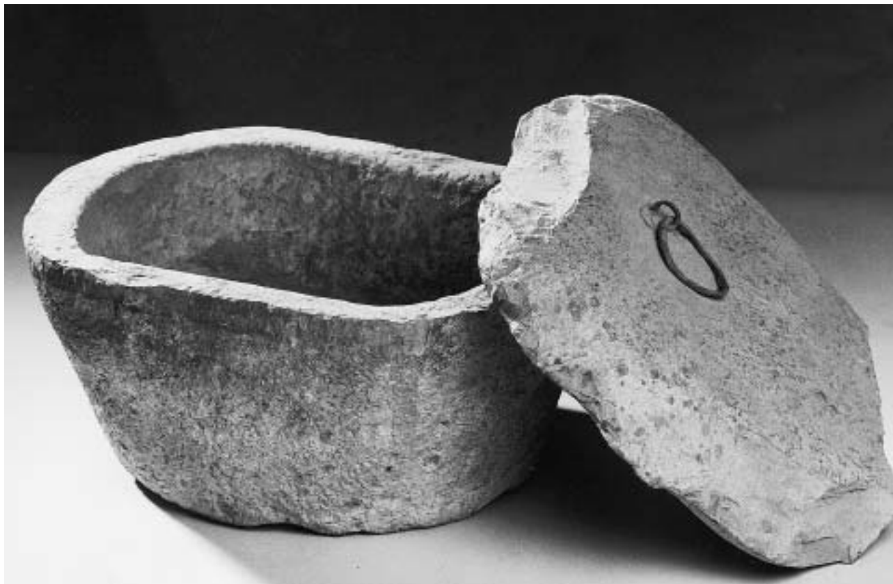
Vorratskasten aus Obermässing, Südliches Mittelfranken, 18./19. Jahrhundert, Fränkischer Jurakalkstein, H. ca. 35 cm HG 12922.

Dass es sich um eine professionell ausgeführte Steinmetzenarbeit handelt, weisen saubere Anlage der Form und akkurate Bearbeitung der Flächen zweifellos aus. Verwandt sind ihr steinerne Brunnenkästen und Futtertröge, die einst fast auf jedem Bauernhof zu finden waren, inzwischen jedoch selten geworden, gelegentlich aber in der nostalgisch inspirierten Funktion von zierenden Pflanzkübeln überkommen sind. Sicherlich entstand der Behälter vor Ort oder in der unmittelbaren Umgebung des Dorfes. Hersteller dürfte ein in einem der nahegelegenen Kalksteinbrüche tätiger Steinbrecher oder Steinmetz gewesen sein. Daneben ist nicht auszuschließen, dass ein in der Steinbearbeitung versierter Landmann, vielleicht sogar der damalige Hauseigentümer selbst oder einer seiner Knechte, das Stück geschaffen hat. Schließlich liegt Obermässing reizvoll am Abhang einer Bergzunge des fränkischen Jura, wo über Jahrhunderte Baumaterial für Städte und Dörfer im Altmühltal und angrenzende, ehemals zum Hochstift Eichstätt gehörige Territorien gewonnen wurde. Allein die Bezeichnung „Bauernbrüche“ verweist schon darauf, dass Abbau und Verarbeitung des Gesteins von den ansässigen Bauern der Gegend selbst vorgenommen worden sind.