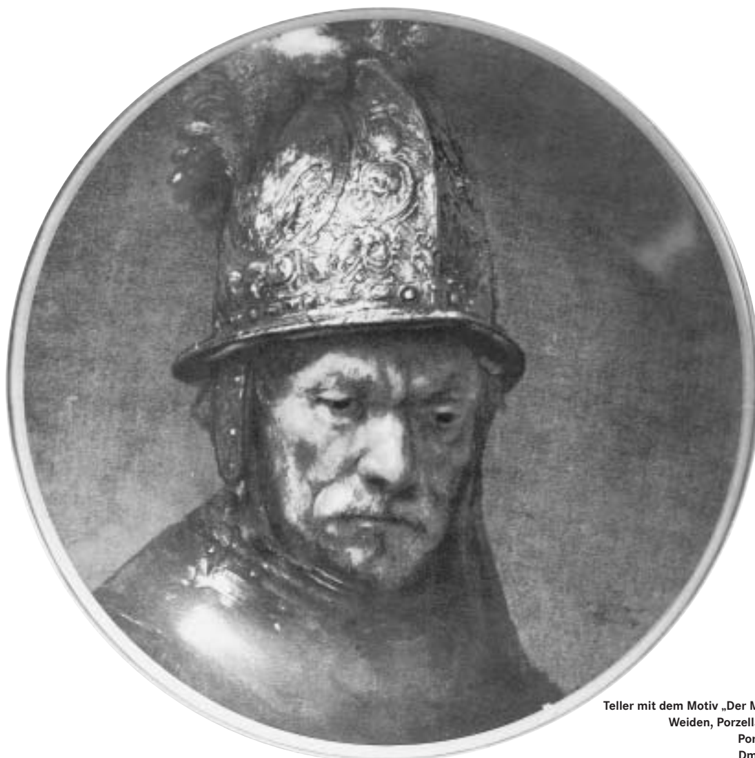
Teller mit dem Motiv „Der Mann mit dem Goldhelm“ Weiden, Porzellanfabrik Seltmann, 1970 Porzellan, Aufglasurmalerei Dm. 26,8 cm, Inv. Des 1288