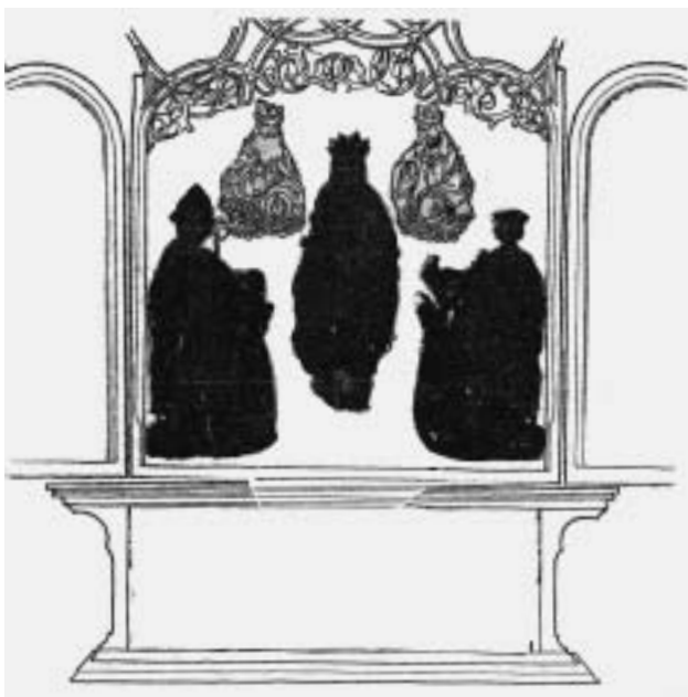
Rekonstruktion eines Marienkrönungsaltars.

Größenverhältnisse legen nahe, dass die vier Fragmente, Heiligenpaare (H. 172 bzw. 178 cm) und Büsten (H. ca. 85 cm), zu einem großen Ganzen gehörten. Sie sind als Teile eines Retabels anzusehen, dessen Thema die Marienkrönung war. Ein gleichartiges Ensemble rekonstruierte Eva Zimmermann 1979 aus Skulpturen, die heute in Museen zu Rottweil und Karlsruhe sowie in Privatbesitz aufbewahrt werden. Ursprünglich bildeten diese Stücke den figürlichen Bestand eines Altaraufsatzes, den Thoman 1515/16 für die St.-Pankratius-Kirche in Wangen bei Konstanz geschaffen hat.