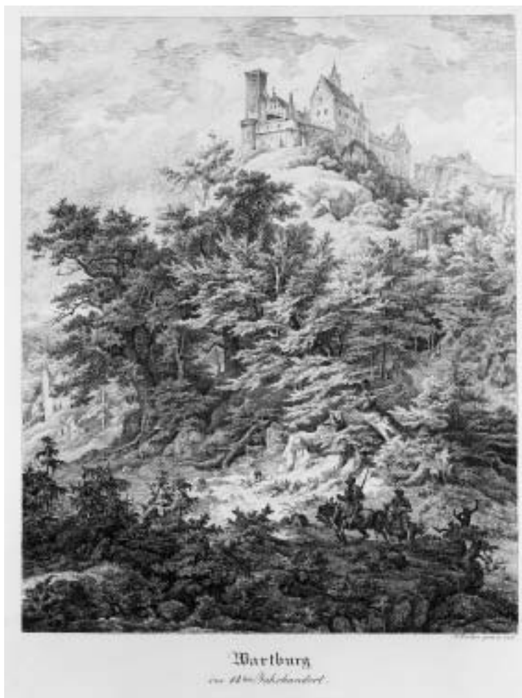
Friedrich Preller d. Ä. (Eisenach 1804–1878 Weimar). Die Wartburg im 14. Jahrhundert. Radierung, 39, 5 x 30,5 cm (Blatt), Inv. Nr. K 6119, Kapsel 279. Alter Bestand.

Diese Ansicht der Burg fand offensichtlich viele Liebhaber, denn der Künstler stellte sie häufiger dar, variiert durch Baum- und Figurenstaffage. In dem 1845 entstandenen Nürnberger Gemälde hat Preller die Landschaft am Fuß des Burgbergs mit einem Schäfer belebt. Zum friedlichen Anblick seiner zwischen üppigem Baumwerk und moosüberwucherten Felsbrocken grasenden Tiere tragen zwei Bauernkinder bei, die eine Kiepe abgestellt haben und auf den Schäfer und seinen struppigen