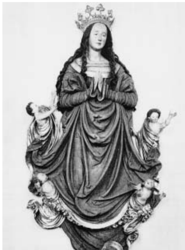
Himmelfahrende Gottesmutter, Pfarrkirche St. Leonhard in Oberliesheim.

Über die im Katalog „Faszination Meisterwerk“ zu den beiden Reliefgruppen zitierte Literatur hinaus ist hinzuweisen auf: Eva Zimmermann: Zur Rekonstruktion des Wangener Altares von Hans Thoman. In: Jahrbuch der Staatl. Kunstsammlungen in Baden-Württemberg, Bd. 16, 1979, S. 47–64; Willi Stähle: Schwäbische Bildschnitzkunst der Sammlung Dursch Rottweil, Bd. 2, 1986, S. 153–167.