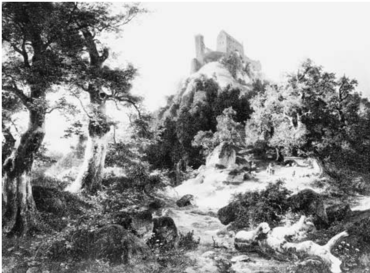
Friedrich Preller d. Ä. (Eisenach 1804–1878 Weimar). Die Wartburg bei Eisenach, 1845. Öl auf Leinwand, 46 x 63 cm, Inv. Nr. Gm 2210. Erworben 1999.

terliche Nürnberg zu einem vaterländischen Symbol. Am 18. Oktober 1817 feierte die Jenaer Burschenschaft ihr berühmtes „Wartburgfest“, mit dem sie des Beginns der lutherischen Reformation im Jahr 1517 sowie des Sieges über Napoleon in der Völkerschlacht bei Leipzig auf den Tag vier Jahre zuvor gedachte. Es war eine Demonstration gegen das Wiedererstarken der Throne nach dem Wiener Kongress, der den deutschen Partikularismus zementiert hatte. Hunderte Studenten aus allen Teilen Deutschlands erschienen auf der Burgruine und sprachen sich für die Errichtung eines einheitlichen deutschen Nationalstaats aus. Der „altdeutsche Rock“, den viele von ihnen als Ausdruck ihrer Gesinnung trugen, wurde von der Obrigkeit verboten. In liberalen Kreisen verkörperte die Burg durch das Fest jedoch noch lange den Wunsch nach einem Deutschland, das über die vieldeutige Definition der „deutschen KulturNation“ hinaus politisch real durch eine egalitäre Bürgerrechte zusichernde Verfassung geeint sein sollte. Goethe hatte 1815 angesichts der nationalromantischen „Liebe