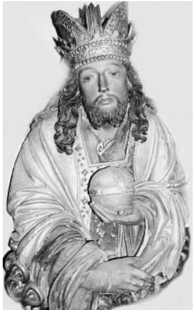
Büste Christi, Privatbesitz.

sämtlichen damals bekannten Werken des Meisters ein Bild von der Persönlichkeit und ihrem Schaffen zu formen. Diese vor gut vier Jahrzehnten getroffenen Ergebnisse sind bis heute, abgesehen von einigen Ergänzungen, im wesentlichen gültiger Forschungsstand. Die beiden jüngst entdeckten Skulpturen erweitern ihn nun um einen wichtigen Punkt.