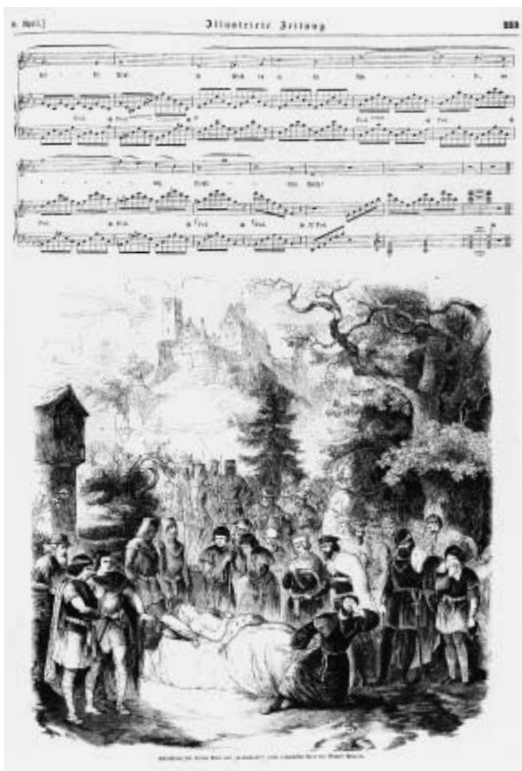
Schluss-Szene des dritten Aktes aus „Tannhäuser“, große romantische Oper von Richard Wagner. Leipziger Illustrierte Zeitung, 9. April 1853, S. 233. Sig. L 272.