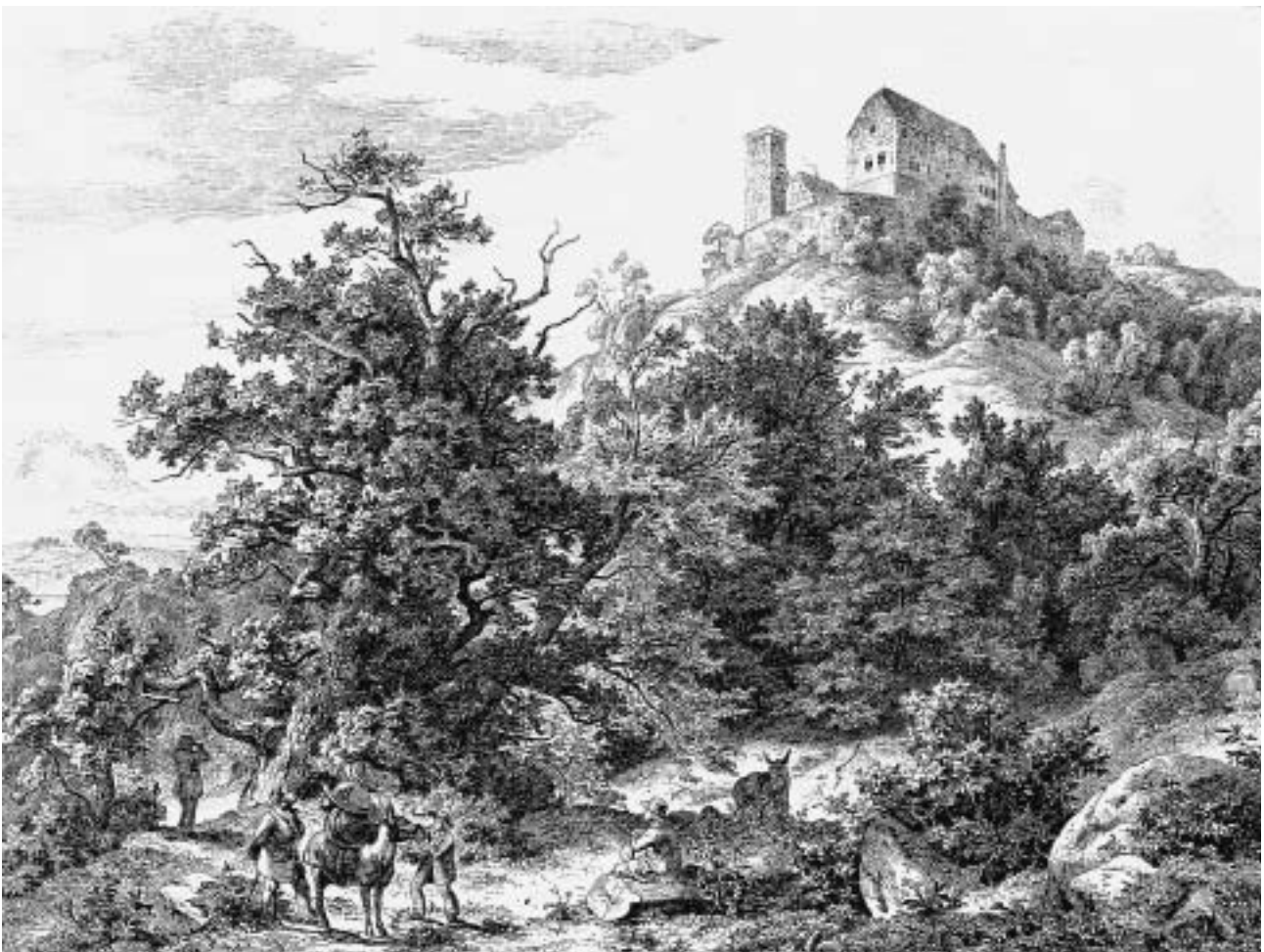
Friedrich Preller d. Ä. (Eisenach 1804–1878 Weimar). Die Wartburg von der Südseite, 1842. Radierung, 20, 5 x 25, 2 cm (Platte). Wartburg-Stiftung, Eisenach.

Preller, im Umfeld Goethes vom Geist der Weimarer Klassik geprägt, hat die Kompositions-idee der idealen Landschaft