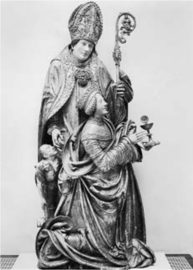
Hll. Martin und Barbara, Germanisches Nationalmuseum.

ter sind mit aufwendig verzierten Bügelkronen geschmückt. Gottvater segnet mit der Rechten; in der Linken trug er vermutlich ein Zepter. Gottsohn hält die Sphaira, das Zeichen uneingeschränkter Herrschaft, vor seine Brust. Mit der Rechten rafft er sein Gewand.