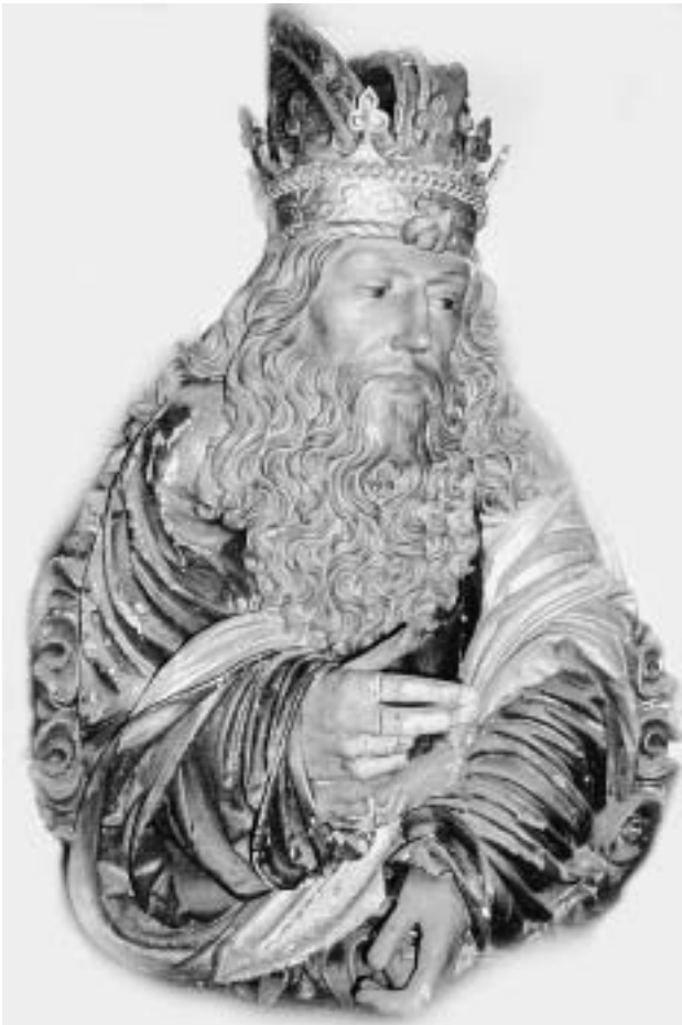
Büste Gottvaters, Privatbesitz.

Eines der bedeutendsten Werke des Künstlers, das nur in Fragmenten erhaltene Retabel, das einst den Hochaltar der ehemaligen Benediktinerabteikirche in Ottobeuren zierte, hatte 1937 zur Bezeichnung des anonymen Bildschnitzers mit dem Notnamen „Meister von Ottobeuren“ geführt. Wiewohl Gertrud Otto schon 1965 wahrscheinlich machen konnte, dass es sich dabei um den weitgehend in Memmingen ansässigen Hans Thoman handeln muss, wird der Notname auf Grund von Aussagekraft und Einprägsamkeit noch heute gern in der Fachliteratur verwendet. Alfred Schädler versuchte 1964 aus