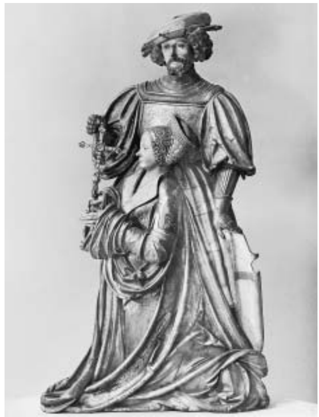
Hll. Georg und Margareta, Germanisches Nationalmuseum.