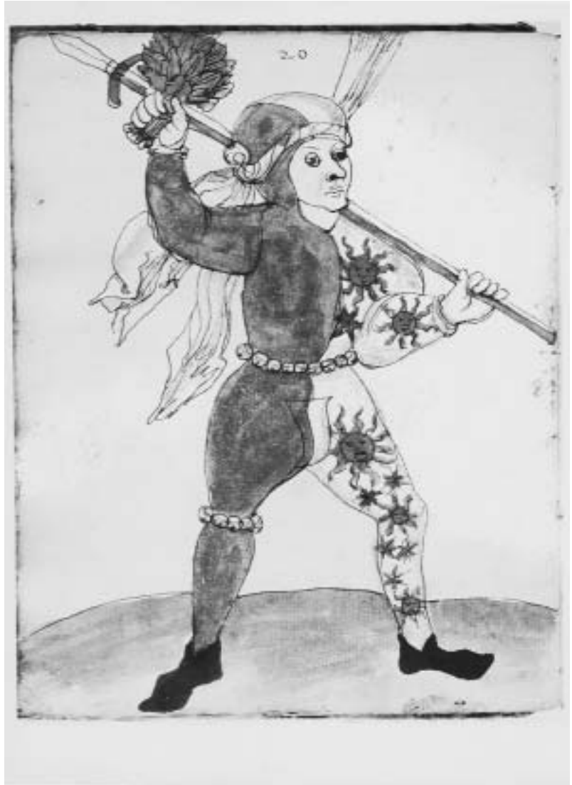
Läufer im Mi-parti-Kostüm aus dem Jahr 1472. Schembartbuch, spätes 16. Jh., Hs. Merkel 342, fol. 23v.