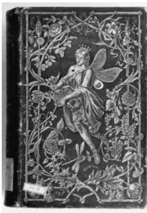
Adolf Böttger, Die Pilgerfahrt der Blumengeister, 1854, Vorderdeckel.

Andere Entwürfe zeigen ein stärkeres erzählerisches Element. Die Schierlingsfrau, die Blütendolden zu einem progressiven Kopfschmuck modifiziert, blickt finster um sich, während sie ihr Gift braut. Nebenfiguren der französischen Vorlage hat Payne eliminiert, um sie für die Gedichte Böttgers zu adaptieren. Böttger macht die Schierlingsfrau mit Namen Cicuta zum Opfer eines Herzogs: „Cicuta's Vater mordete sein Stahl, / Und zwang sich dann die Tochter zum Gemahl“ (S. 238). Und noch grausamer spinnt Böttger seine Verse fort. Aus dem Schädel des toten Vaters muss Cicuta dem Tyrannen zutrinken. Am Ende haben sich die Hauptbeteiligten auf niederträchtigste Weise gegenseitig ermordet. „Mit krampf'gen Händen und zerrauftem Haar / Stürzt tot zu Boden – Brust an Brust das Paar“