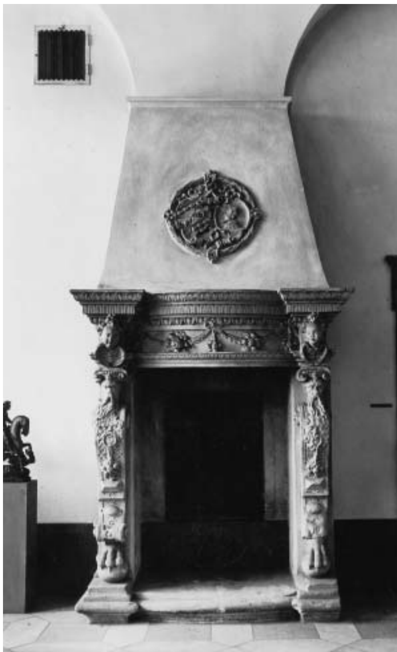
Kamin, Nürnberg, um 1588/1600, Sandstein, ursprünglich farbig gefasst, Inv.Nr. A 3004.

Der reiche plastische Dekor macht den Kamin zugleich ansprechend und kunstgeschichtlich interessant. Zudem haben sich an den Wappen und in geringerem Ausmaß an linker Wange