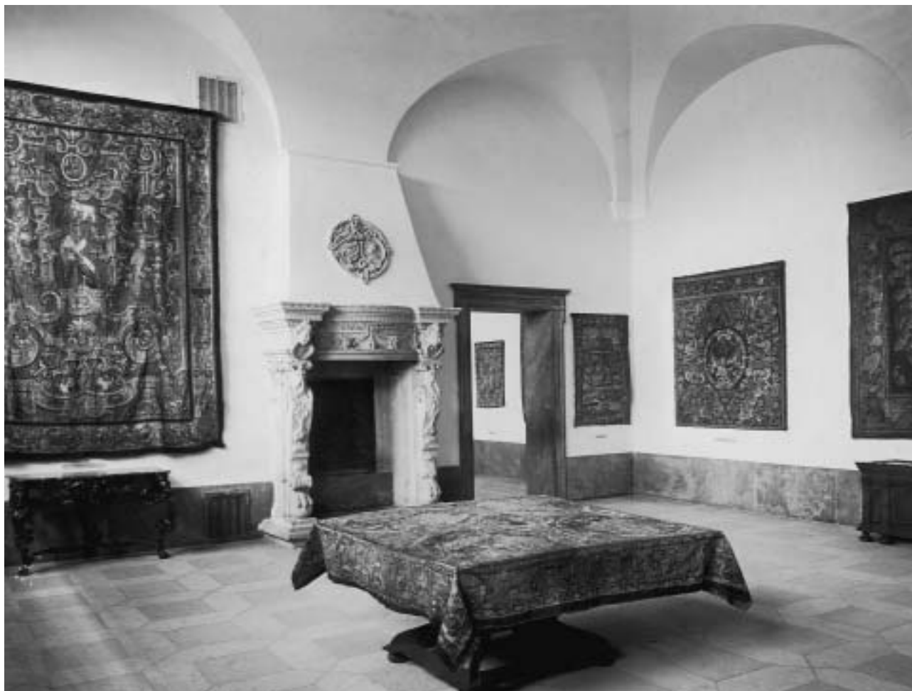
Der alte Barocksaal im Untergeschoss des Galeriebaus, Aufnahme von 1948.

und Front Farbreste erhalten. Leider ließ sich bisher nicht feststellen, wie die vollständige Fassung ausgesehen hat und wann sie entfernt worden ist. Schulz bezeichnet den Kamin am ursprünglichen Standort als „stark überstrichen“; auf einer Fotografie von 1948 erscheint das Exponat wie heute steinsichtig.