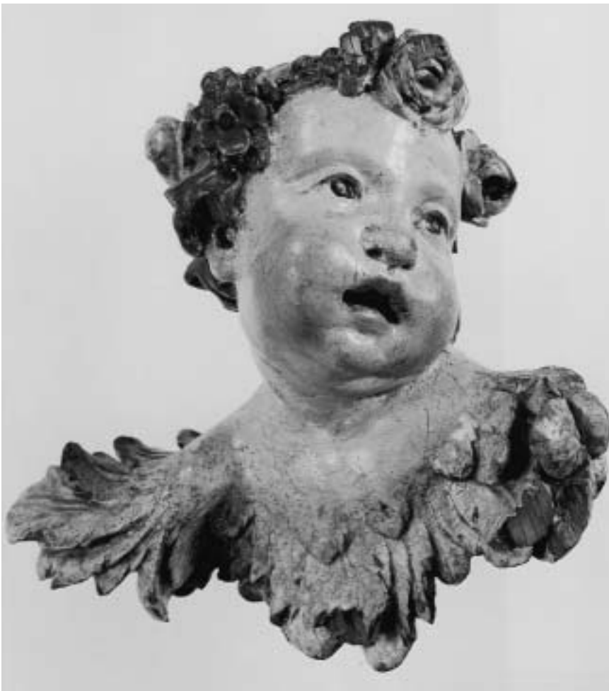
Ignaz Günther, Geflügeltes Puttenköpfchen, um 1765–1775. Lindenholz, gefasst, H. 27 cm. Inv.Nr. Pl.O. 2719, erworben 1934. Kat.Nr. 125.

Einen weiteren Schwerpunkt der Nürnberger Sammlung bildet die Wiener Plastik des 18. Jahrhunderts mit Werken von Lorenzo Mattielli, Georg Raphael Donner, Jakob Gabriel Mollinarolo, Johann Baptist Hagenauer und Franz Xaver Messerschmidt (Kat.Nr. 203–214). Hierunter sind sowohl flott skizzierte Tonbozzetti als auch die für Wien typischen matt polierten Bleigüsse, die einen überzeugenden Eindruck von der hohen gestalterischen Qualität der akademisch geprägten Wiener Bildhauerkunst vermitteln. Außerdem gibt die Sammlung des Germanischen Nationalmuseums einen Einblick in die Werkstattpraxis der Innviertler Bildhauerfamilie Schwanthaler, die ihr charakteristisches volkstümliches Formenreper-