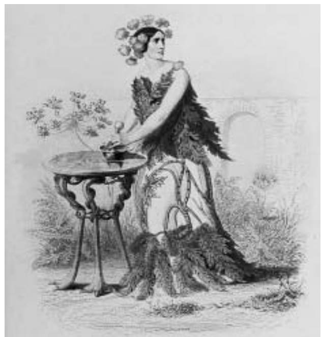
A. H. Payne nach Grandville: Schierling, in: Die Pilgerfahrt der Blumengeister , 1854.