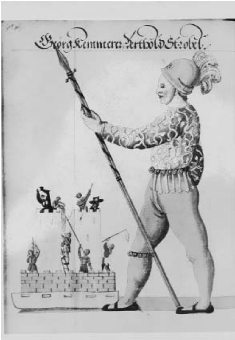
Läufer und Hölle in Gestalt von zwei Türmen aus dem Jahr 1504. Nürnberger Chronik, 1600, Hs. Merkel 920, fol. 408v.

Der Durchbruch der Reformation in Nürnberg bedeutete 1524 das Ende des Schembartlaufs. Er erlebte zwar im Jahr 1539 noch eine Wiederbelebung, doch durch die Verunglimpfung des reformatorischen Predigers Andreas Osiander auf dem Höllenwagen kam es zum Eklat: Der Nürnberger Rat verbot die Schembartläufe mit Nachdruck. Im Bestand der Bibliothek befindet sich ein solches vom Rat erlassenes Verbot der „Faßnachten und Mumereyen“ aus dem Jahr 1553 [Sammlung Merkel: D 3723].