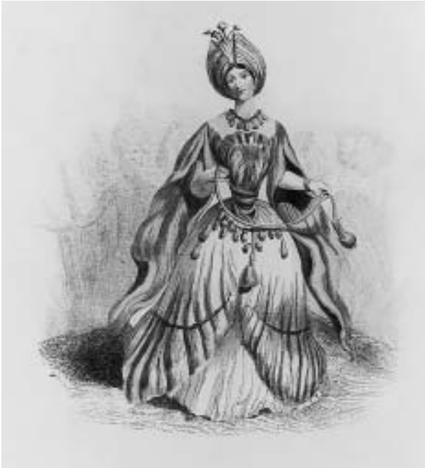
A. H. Payne nach Grandville: Tulpe, in: Die Pilgerfahrt der Blumengeister , 1854.

(S. 248). Hier wird das Dilemma des Gedichtbandes greifbar. Die teils gefühlvollen, teils blutrünstigen Verse Böttgers sind von niedrigstem Niveau.