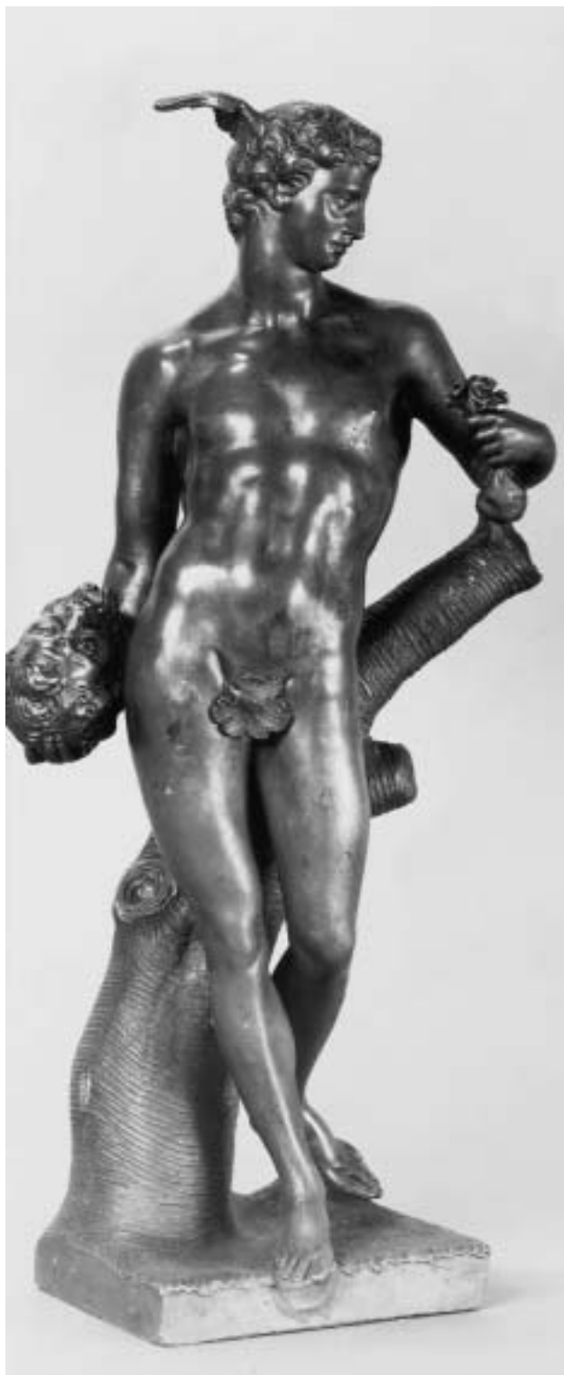
Georg Raphael Donner, Merkur mit dem Haupt des Argus, um 1740–1745. Blei-Zinn-Legierung, H. 39,2 cm. Inv.Nr. Pl.O. 2381, erworben 1926. Kat.Nr. 207.

toire über mehrere Generationen hinweg tradierte (Kat.Nr. 181–184).