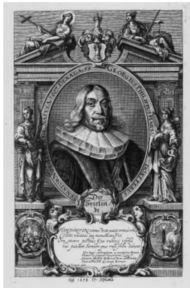
Jacob von Sandrart nach Georg Strauch, Porträt Georg Philipp Harsdörffers (1607–1658), Kupferstich, 23,4 x 15,5 cm, 1658, Nürnberg, Germanisches Nationalmuseum, Graphische Sammlung, Inv. P. 26108a.

Wie aber entstand das geflügelte Wort vom „Nürnberger Trichter?“ Das Bild vom Eingießen oder Einflößen der Weisheit durch einen Trichter ist älter als die Bezeichnung des Gerätes