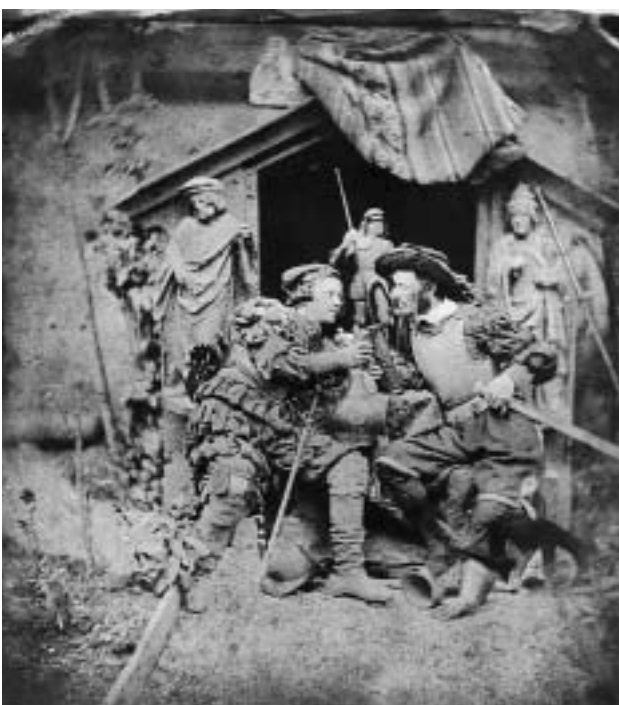
Lebendes Bild nach einer „Humpenburger“ Zeichnung von Ludwig Schwanthaler, um 1860. Fotografie. Stadtmuseum, München.

Der zünftige Gefäßtyp des Humpens war aber schon im frühen 19. Jahrhundert von der vaterländischen Romantik mit ihrer Vorliebe für Mittelalter und Ritterzeit als "altdeutsches" Requisite entdeckt worden. Nach der Auflösung des „Heiligen Römischen Reiches deutscher Nation“ während Napoleons Vorherrschaft in Europa verkörperte das Mittelalter vergangene „deutsche Größe“. August von Kotzebue komponierte um 1813 eine komische Oper, mit der er die romantische Schwärmerei für das Mittelalter verspottete und in deren Titel er lustvoll das damals „mittelalterliche Herrlichkeit“ assoziierende Wort Humpen einbaute. Er lautete: „Hans Max Gießbrecht von der Humpenburg oder die neue Ritterzeit“. Der Titelheld, der eigentlich von Ellern heißt, ist, wie seine Magd eingangs in dem Stück klagt, zufällig „über die verdammten Ritter-Romane gerathen ...und nun ist ihm der Kopf so voll von Rittern, Knapen und Burgen und Humpen et caetera et caetera, und er hat sich dermaßen in das Mittelalter verliebt, dass unsere schöne und neue Zeit ihm zum Ekel und Abscheu geworden und er durchaus nur noch im 14. Jahrhunderte leben will...“ Seiner Tochter Elise gibt er den deutschen Namen Gertrud und er will sie nur noch mit einem wahren deutschen Rittersmann verheiraten. Über die tiefere Bedeutung des Humpens gibt eine Arie Kund: