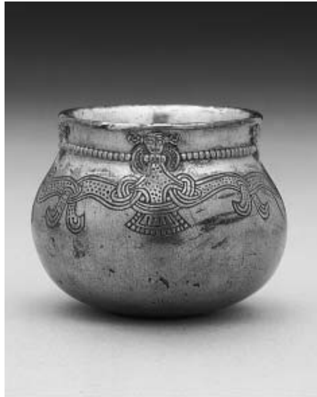
Trinkgefäß aus dem Schatz von Leire, Silber, vergoldet, mit Nielloeinlagen, H. 4,4 cm, Südkandinavisch, 10. Jh. Nationalmuseum Kopenhagen, 11373.

Der Nürnberg am nächsten gelegene Kirchenbau der Karolingerzeit ist die Sola-Basilika in Solnhofen. Sola, ein Gefolgsmann von Bonifatius, war ein angelsächsischer Mönch der sich im Altmühltal im unmittelbaren Umfeld des von seinen Landsleuten Willibald, Wunnibald und Walburga etwa gleichzeitig gegründeten Klosters Heidenheim und des Bistums Eichstätt niedergelassen hatte. In einer klösterlichen „cella“ lebte er als Christ und Landwirt und überzeugte durch sein aktives Beispiel seine Mitmenschen vom Christentum.