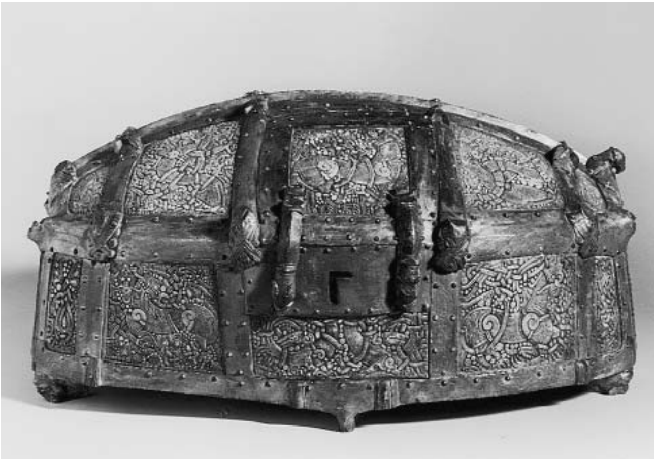
Gipsabformung des Schreines von Cammin (Kamien), Pommern, Polen, Im Original (Kriegsverlust): Elchgeweih (?) Holz und vergoldete Bronze. Maße in cm: L. 63; B. 35; H. 26, Um 1000, mit späteren Ergänzungen, Skandinavisch. Inv. Nr.: KG 397 / FG 917.

BLICKPUNKT JANUAR. Der Schrein aus dem Domschatz von Cammin (Kamien), Pommern, Polen, ging Ende des 2. Weltkrieges verloren. Heute gibt es nur noch Abformungen dieses Schreines. Eine davon befindet sich glücklicherweise in Besitz des Germanischen Nationalmuseums. Sie wurde vom Berliner Kunstgewerbemuseum 1896 erworben und vermutlich in der Gipsformerei der königlichen Museen zu Berlin hergestellt. Im Dänischen Nationalmuseum, Kopenhagen befindet sich eine weitere Abformung.