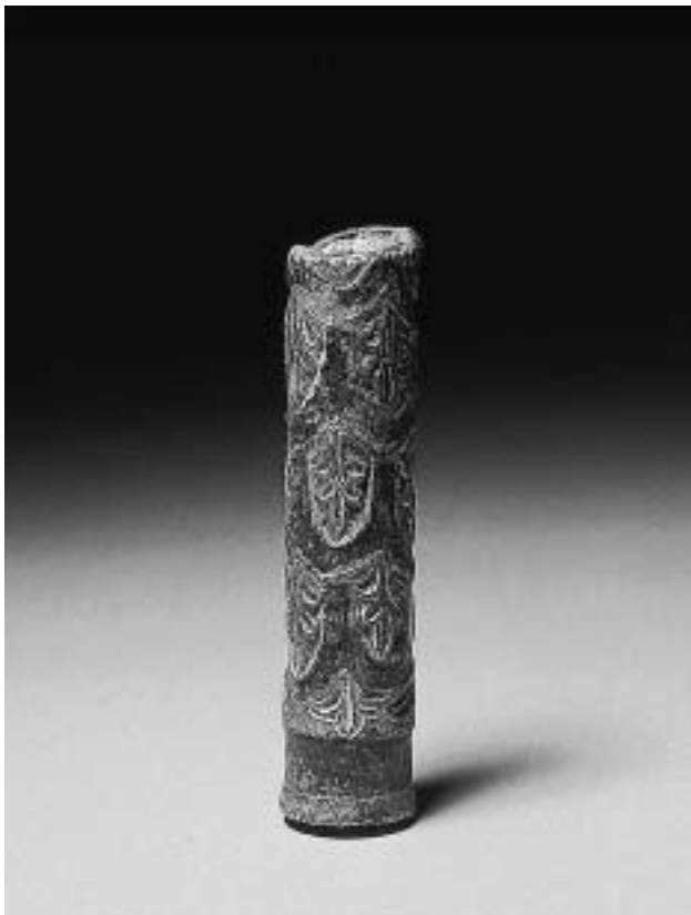
Fragment eines Amtsstabes, Bronze mit Blei und Eisen, Palmetten vergol- det, L. 10 cm, 9. Jh., GNM, R 352.

angelegt, auf denen die Schiffe bewegt werden konnten. Das Bauwerk sollte die Nachschubsituation für die kriegerischen Auseinandersetzung mit den Awaren verbessern, die 788 in Bayern eingefallen waren. Karls Chronist und Biograph Einhard berichtet, dass das Werk, für das wohl ca. 5000 Arbeiter für mehrere Monate herangezogen worden waren, misslang, weil andauernde Regenfälle das ausgehobene Material wieder eingeschwemmt hätten. Archäologische Untersuchungen und Bohrungen zeigten aber durch den Fund einer stattlichen Schicht von Seekreideablagerungen, dass die im Luftbild noch gut erkennbaren Becken durchaus längere Zeit offenes Wasser enthielten und geflutet waren. Noch heute sind direkt beim Ort Graben riesige Wälle zu beiden Seiten des mit 500 m Länge wohl größten Beckens dieser Anlage zu sehen. Auf weiteren etwa 1,5 Kilometern sind die Wälle im Gelände erkennbar.