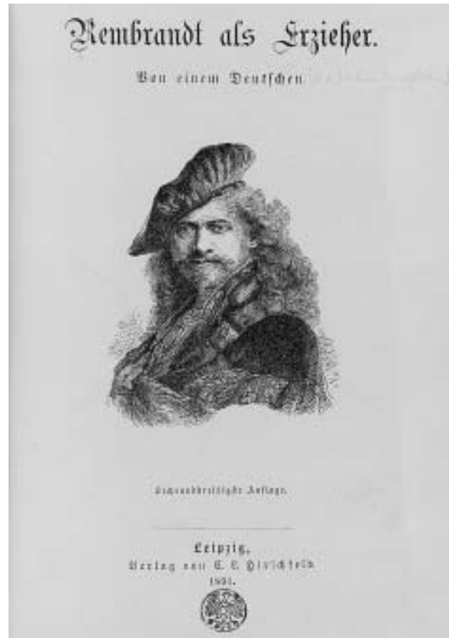
Julius Langbehn, Rembrandt als Erzieher. Von einem Deutschen , Leipzig 1891. Sig. 8° Fe 189/1, Erworben 1891.

Als „alt deutsch“ konnte gelten, was dem zwecks nationaler Abgrenzung vielbeschworenen „deutschen Gemüth“ mit seiner angeblich besonders „lauteren“ Heiterkeit und geradezu unvergleichbaren „Tiefe“ zu entsprechen schien. Beispielhaft ist Julius Langbehns 1890 erstmals veröffentlichte und viele Neuauflagen erlebende Schrift „Rembrandt als Erzieher“. Sie erschien zunächst anonym und hatte den Untertitel „Von einem Deutschen“, der in national hochgestimmten Ohren