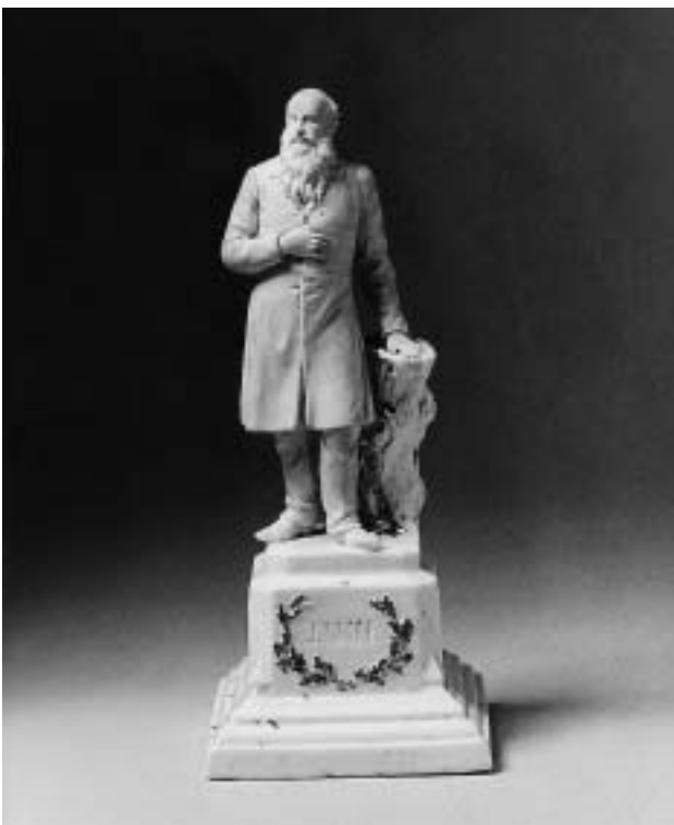
Zimmerdenkmal Friedrich Ludwig Jahns, um 1900. Porzellan, weißlicher Scherben, teilvergoldet, ungemarkt, H. 19,2 cm. Inv. Nr. Ke 2973. Erworben 1965.

Der „echte“ Deutsche, so Kotzebues satirische Betrachtung nationalromantischer Selbstbespiegelung im Vergangenen, trinkt nicht aus welschen Bouteillen und zum gezierten Nippen nötigen Gläsern, sondern aus großen „deutschen“ Humpen und beweist damit vaterländische Gesinnung. Die Arien der Ritteroper, die sich schön schmetterten ließen, trugen anders als von Kotzebue beabsichtigt zur Lust am modernen Rittertum bei. Unter der Federführung von Franz Graf von Pocci und dem Bildhauer Ludwig Schwanthaler entstand 1818 in München die „Xellnschaft der Humpenburg“, ein Tummelplatz für Freizeiterritter, der in gehobenen Kreisen der biedermeierlichen Gesellschaft Anklang fand. Auch andernorts entstanden Ritterrunden, die Armbrustschießen, spaßige Raubritterspiele und Gelage veranstalteten und in denen prächtige Pokale sowie die im 14. Jahrhundert noch gar nicht erfundenen Humpen unentbehrliche Requisiten waren.