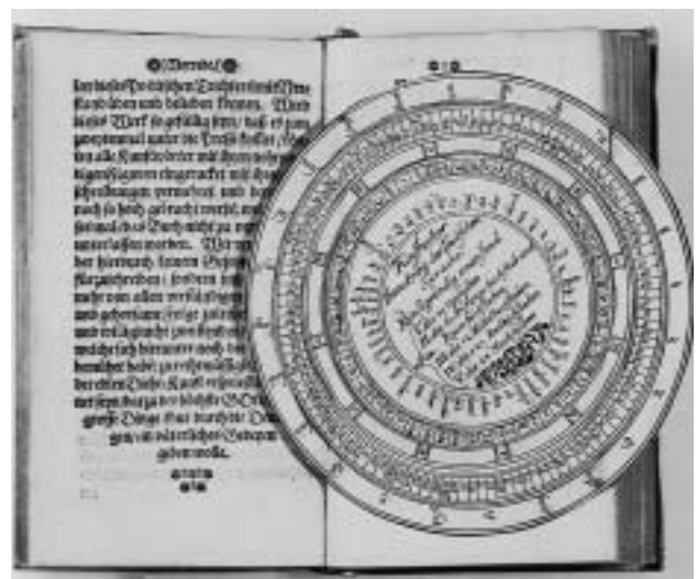
Fünffacher Denckring der deutschen Sprache aus Harsdörffers „Poetischem Trichter“, Bd. 3, Nürnberg 1653. Bibliothek des Germanischen Nationalmuseums, Sign. 8 o Ol 164/1, Slg. N 943.