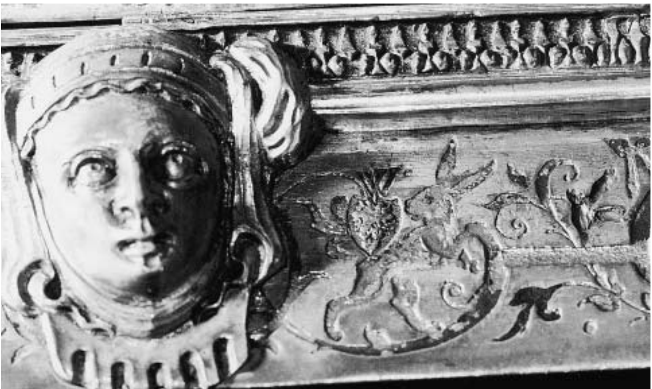
Nürnberger Goldschmiedearbeiten aus dem Besitz des GNM.

gen zweifellos ein besonderes Privileg. Die lange Laufzeit ermöglichte den Aufbau eines Archivs, das auch nach dem Abschluss des Forschungsprojektes bestehen bleibt und erweitert werden soll. Das Manuskript für eine zweibändige Publikation zu den Nürnberger Silbermarken, den Goldschmieden und den Werken wurde mit Projektabschluss fertig gestellt (Nürnberger Goldschmiedekunst. 1541–1868, Meister, Marken, Werke). Der erste Band umfasst rund 1150 Meisterbiographien mit etwa 400 Werkverzeichnissen; circa 900 unterschiedliche Marken konnten dokumentiert werden und etwa 7400 Werke wurden erfasst. Die Markenabbildungen entstanden in einem aufwendigen Verfahren bei dem die Stempel anhand der Originale abgeformt und reproduziert wurden. Das Manuskript enthält auch einen Abschnitt über fragwürdige Marken und Werke, die vermeintlich nach Nürnberg weisen. Das Nachschlagewerk will dem Leser ein Hilfsmittel zur adäquaten Beurteilung von Nürnberger Goldschmiedearbeiten bieten. Es erleichtert dem Benutzer authentische Nürnberger Marken von zweifelhaften bzw. nicht authentischen Marken zu scheiden. Zu wünschen wäre, dass das Buch wie geplant 2006 in Druck gehen kann. Der Tafelband (Bd. 2) umfasst mehrere hundert schwarzweiße Abbildungen, die einen reprä-