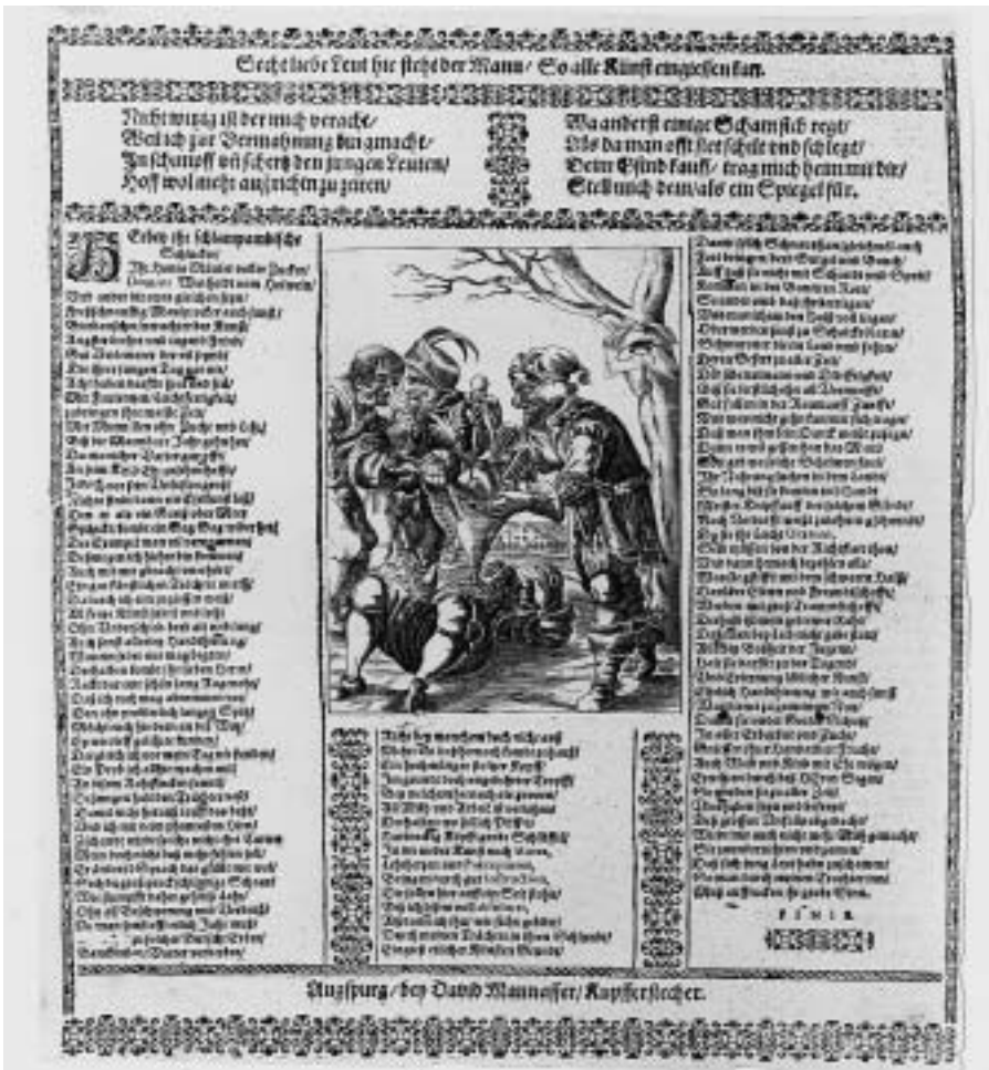
David Manasser, Flugblatt mit Darstellung des „Trichters der Weisheit“, Kupferstich / Holzschnitt / Typendruck, 35,2 x 29,8 cm, um 1650, Nürnberg, Germanisches Nationalmuseum, Graphische Sammlung, Inv. HB 24807/1294.

denen etwas „eingetrichtert“ wird. Sie karikieren auch eine rein mechanische Wissensvermittlung. Das Wissen des Schülers beruht nicht auf dessen Erkenntnis und der intellektuellen Durchdringung des Lehrstoffs, sondern einzig auf seiner Gedächtnisleistung: Er kann Auswendiggelerntes zwar wiedergeben, verstanden hat er es jedoch nicht.