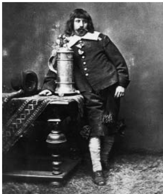
Lebendes Bild vom Fest der „Allotria“, 19. 2. 1876: ein als Zunftmeister verkleideter Künstler. Fotografie. Stadtmuseum, München.

Bei der Form der Krüge haben die in der Spätrenaissance aufkommenden Humpen Pate gestanden. Diese Trinkgefäße dienten dem Genuss von Würzwein, auf Grund ihrer beachtlichen Größe aber vor allem von Bier. Sie waren ausschließlich in europäischen Regionen mit Bierbrautradition, in Deutschland, England, Holland und Skandinavien verbreitet. Die großen Humpen waren im gefüllten Zustand natürlich schwer und damit man sie gut heben konnte, mit einem Henkel versehen.