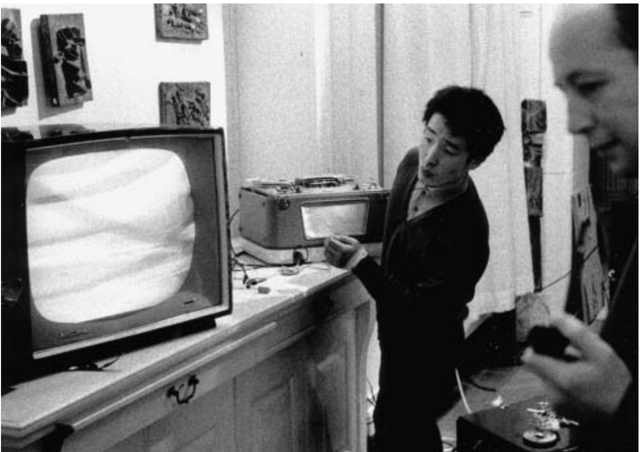
Nam June Paik und Karl Otto Götz mit „Kuba-TV“.