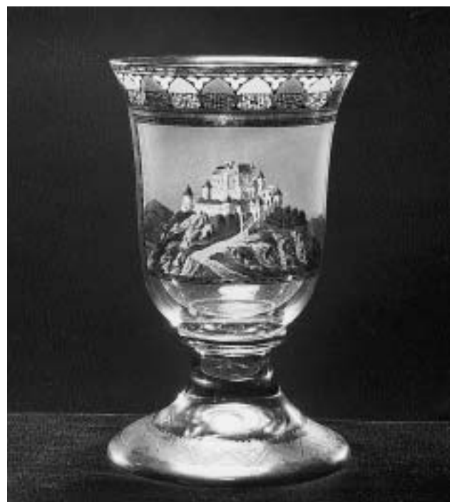
Gottlob Samuel Mohn. (Weißenfels 1789–1825 Laxenburg). Pokal einer „Ritterrunde“ mit Darstellung der Burg Krumpach, um 1815/20. Glas, bemalt. Inv. Nr. Gl 459. Erworben 1966.