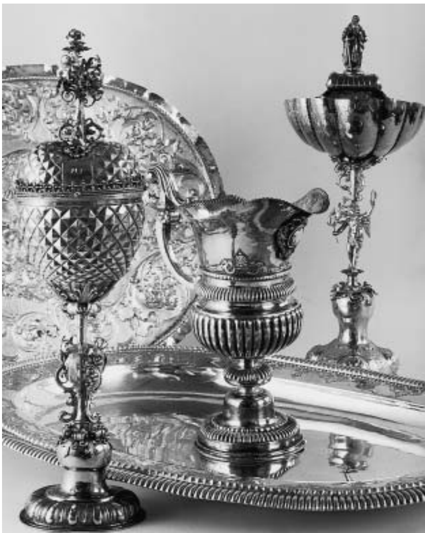
Meisterzeichen des Wenzel Jamnitzer (Löwenkopf im Schild mit der Initialen W). Schmuckkassette, um 1560/1571, Bayerische Schlösserverwaltung, Schatzkammer der Residenz.

sentativen Querschnitt der Produkte des Nürnberger Goldschmiedehandwerks wiedergeben. Höhepunkte sind hier ebenso vertreten wie einfache Arbeiten.