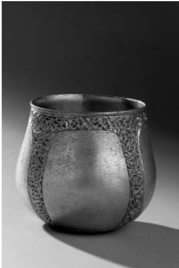
Der Pettstadter Becher – Hostienpyxis, Silber, vergoldet, H. 10,2 cm, ostfränkisch, Ende 8. Jh., GNM, FG 1966.

Als Karl 771 nach dem Tod seines Bruders alleiniger König der Franken wird, setzt er alles daran, das Werk seiner Vorfahren fortzusetzen.