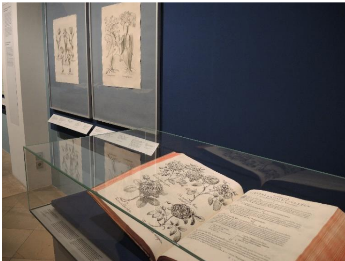
05_Basilius Besler: Hortus Eystettensis, Eichstätt / Nürnberg 1713 Germanisches Nationalmuseum, Bibliothek