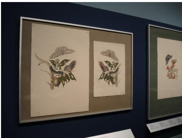
06_Gummibaum / Weiße Hexe, aus: Maria Sibylla Merian: Metamorphosis insectorum Surinamensium, Amsterdam 1705 Germanisches Nationalmuseum, Bibliothek