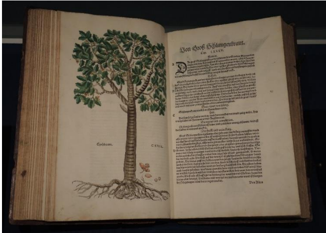
04_Eiche, Tafel 129 aus: Leonhart Fuchs: New Kreütterbuch, Basel 1543 Germanisches Nationalmuseum, Bibliothek