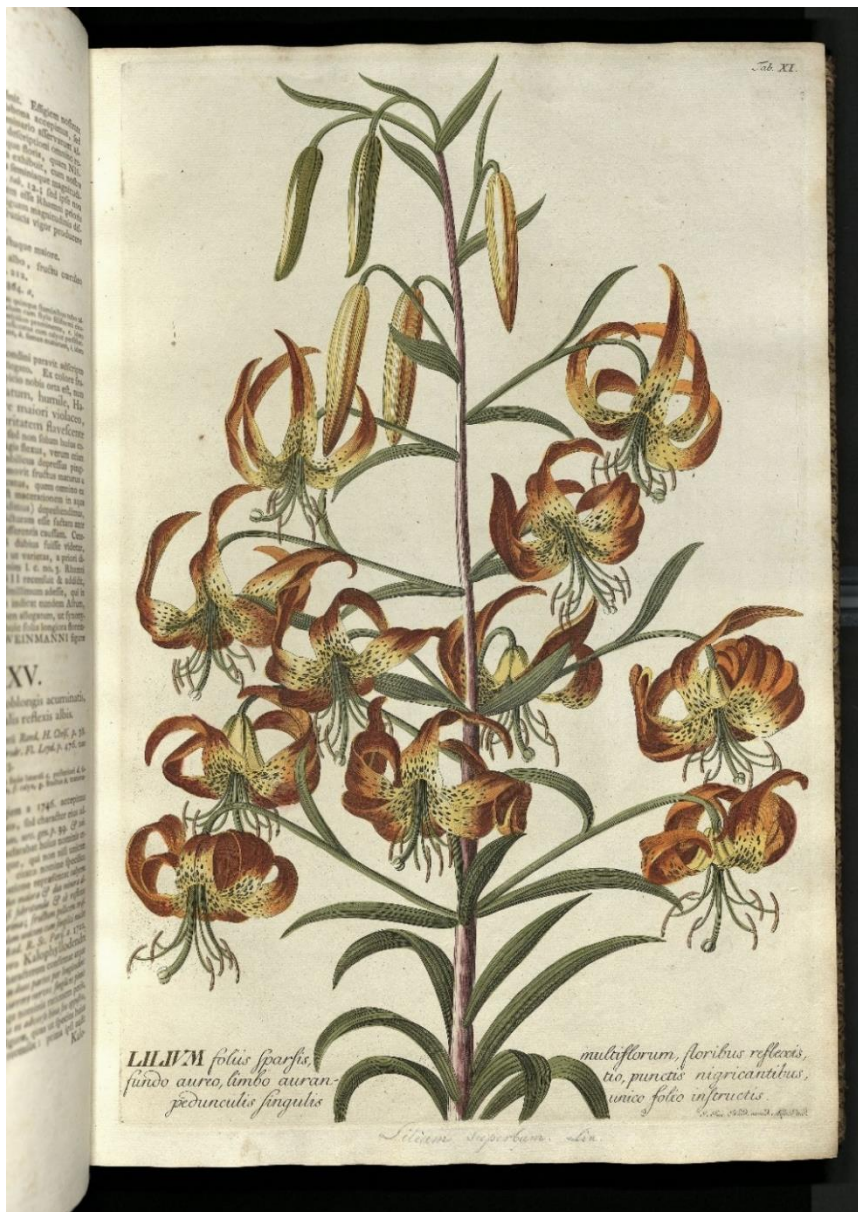
01_Türkenbundlilie, Tafel XI aus: Christoph Jacob Trew: Plantae Selectae , Nürnberg / Augsburg 1771 Germanisches Nationalmuseum, Bibliothek