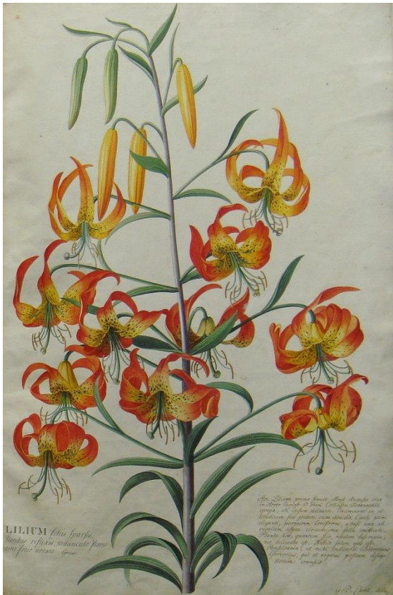
02_Georg Dionysius Ehret: Türkenbundlilie (Amerika) / Lilium superbum L., 1738-61 Aquarell aus einem 109 Blätter umfassenden Konvolut mit Zeichnungen 54 cm hoch x 35 cm breit Germanisches Nationalmuseum, Dauerleihgabe der Kunstsammlungen der Stadt Nürnberg