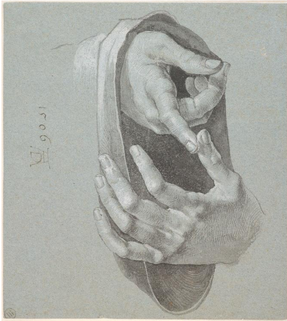
08_Albrecht Dürer: Die Hände des zwölfjährigen Jesus, 1506 Germanisches Nationalmuseum, Nürnberg