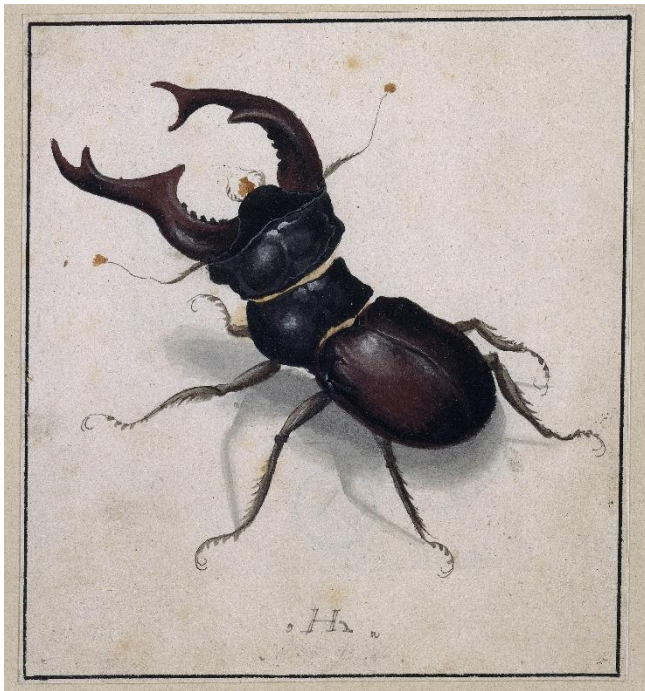
12_Hans Hoffmann: Hirschkäfer, um 1574/80 Staatliche Museen zu Berlin, Kupferstichkabinett