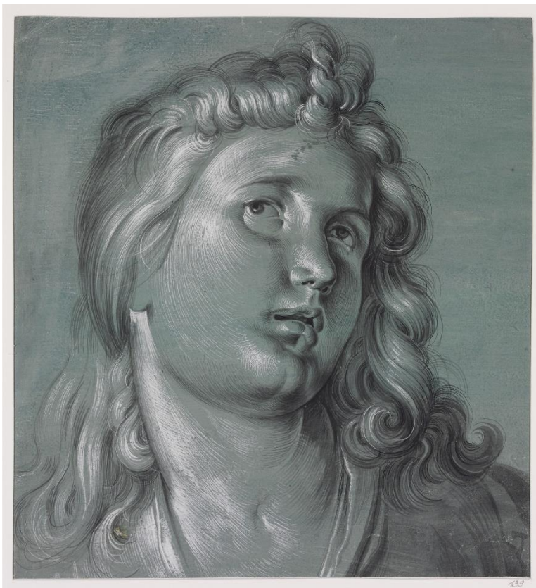
09_Hans Hoffmann: Kopf eines Engels, um 1580/85 Szépművészeti Múzeum, Budapest