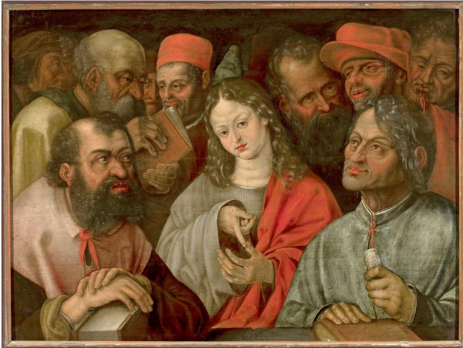
06_Hans Hoffmann zugeschrieben: Jesus unter den Schriftgelehrten, 1585/90 Muzeum Narodowe w Warszawie, Warschau