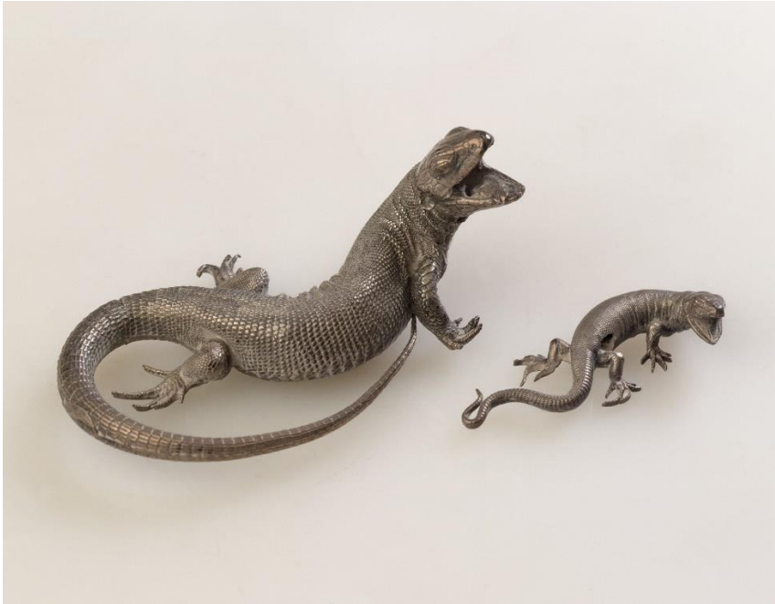
14_Umkreis Wenzel Jamnitzer: Zwei Naturabgüsse von Eidechsen, um 1540/50 Germanisches Nationalmuseum, Nürnberg, Dauerleihgabe der Museen der Stadt Nürnberg, Kunstsammlungen