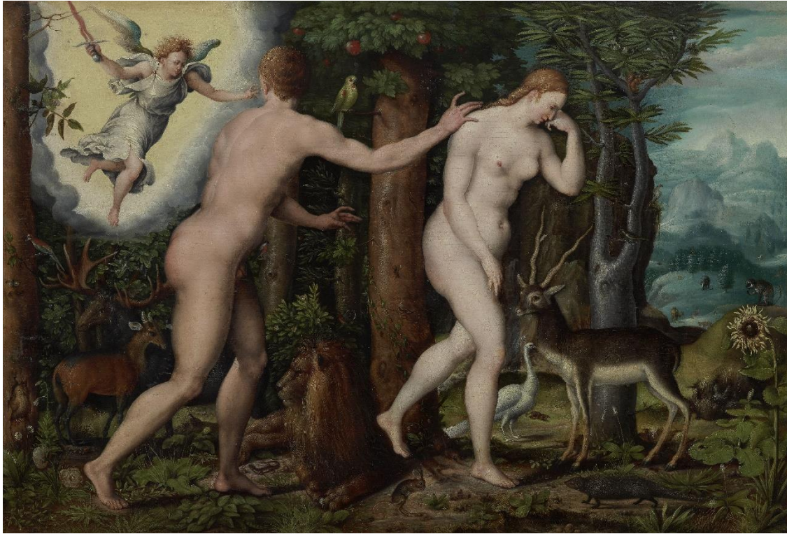
16_Hans Hoffmann zugeschrieben: Vertreibung aus dem Paradies, um 1585/90 Kunsthistorisches Museum Wien, Gemäldegalerie