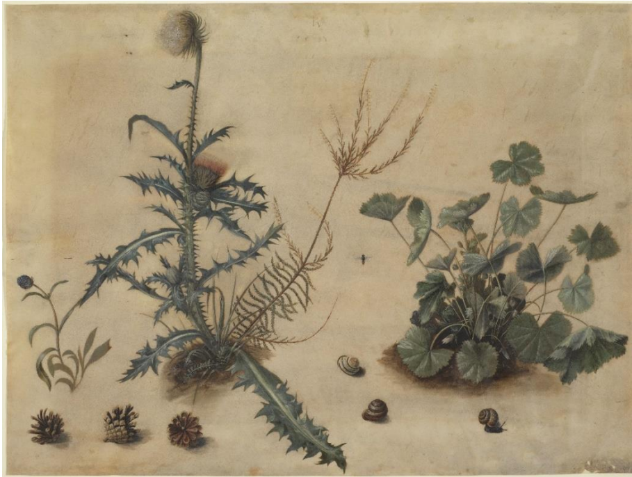
10_Hans Hoffmann: Distel und Erdbeere mit Föhrenzapfen und Schnecken, 1583 Germanisches Nationalmuseum, Nürnberg