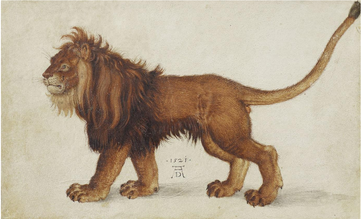
04_Albrecht Dürer: Löwe, 1521 Wien, Albertina