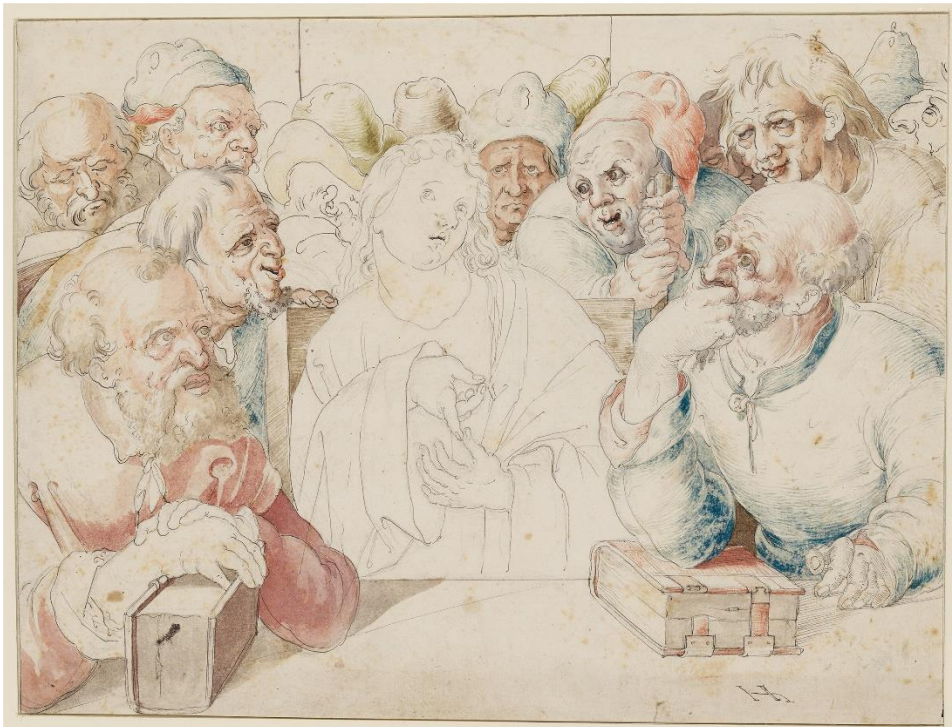
07_Hans Hoffmann: Der zwölfjährige Jesus im Tempel, um 1580/85 Szépművészeti Múzeum, Budapest