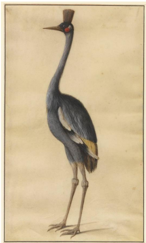
11_Hans Hoffmann: Kronenkranich, um 1585 Germanisches Nationalmuseum, Nürnberg, Dauerleihgabe der Museen der Stadt Nürnberg, Kunstsammlungen