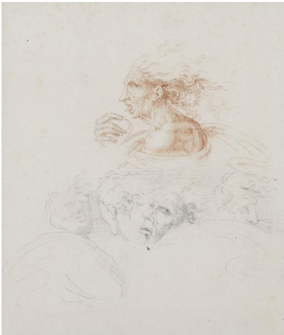
15_Hans Hoffmann: Grotteske Köpfe, um 1580/85 Szépművészeti Múzeum, Budapest